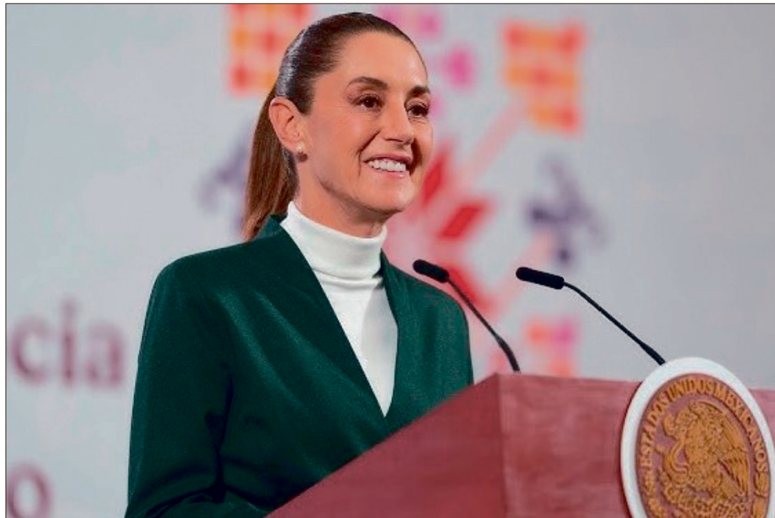
▲ La presidenta Claudia Sheinbaum presentó el 17 de marzo su plan B para la reforma electoral.

En los municipios que tengan una población de entre 30 mil y hasta 50 mil habitantes, contarán