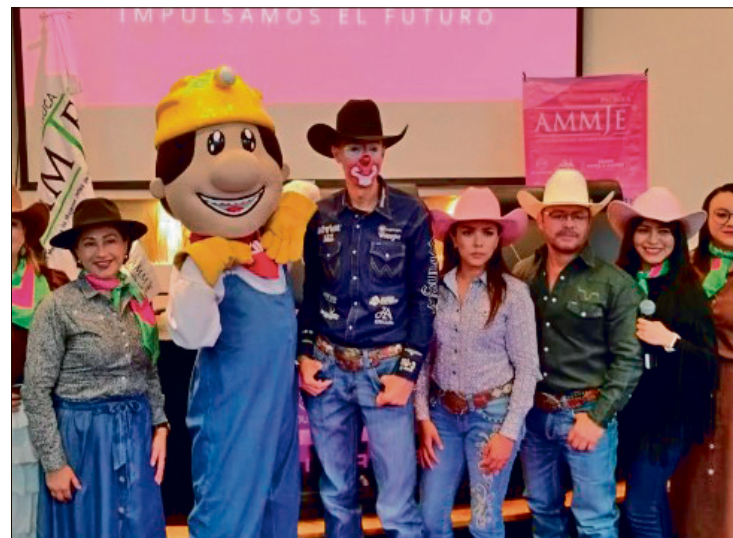
▲ Dieron a conocer la realización del evento con causa The Ultimate Rodeo Challenge, por parte de Cuernos Chuecos.

Fabiola Monroy recordó que este evento forma parte de las diversas actividades que realizará la Asociación de cara a buscar el reconocimiento, mismo que han ganado representaciones como Zapopan, Jalisco, o Tamaulipas.