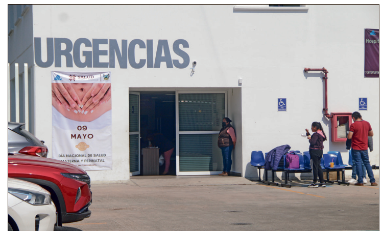
▲ La razón de mortalidad materna en Hidalgo es actualmente de 24.1 defunciones por cada 100 mil nacimientos estimados.

Aunque Hidalgo cerró 2025 con una tendencia a la baja —con un total de seis muertes maternas, lo que representó una disminución de ocho casos frente a las 14 defunciones de 2024—, el registro de dos muertes en apenas las primeras 10 semanas de 2026 advierte una tendencia al alza que podría superar las cifras del año anterior.