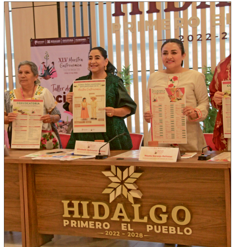
▲ Ayer fue presentado el cartel oficial de la XLV Muestra Gastronómica de Santiago de Anaya.

El programa cultural incluirá presentaciones de música, danza y