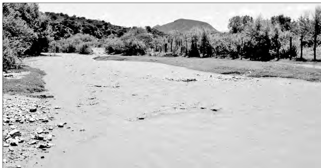
▲ El 6 de agosto de 2014, un derrame de ácido sulfúrico contaminó los ríos Sonora y Bacanuchi.