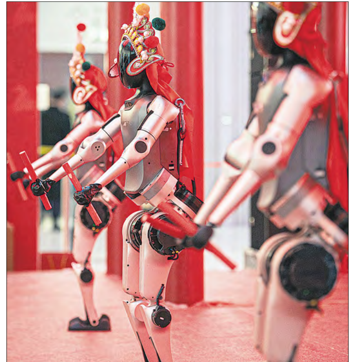
▲ Robots humanoides realizan una danza sincronizada durante la vista previa para los medios de una feria de templos robóticos celebrada antes del Año Nuevo Lunar en Pekín, China.