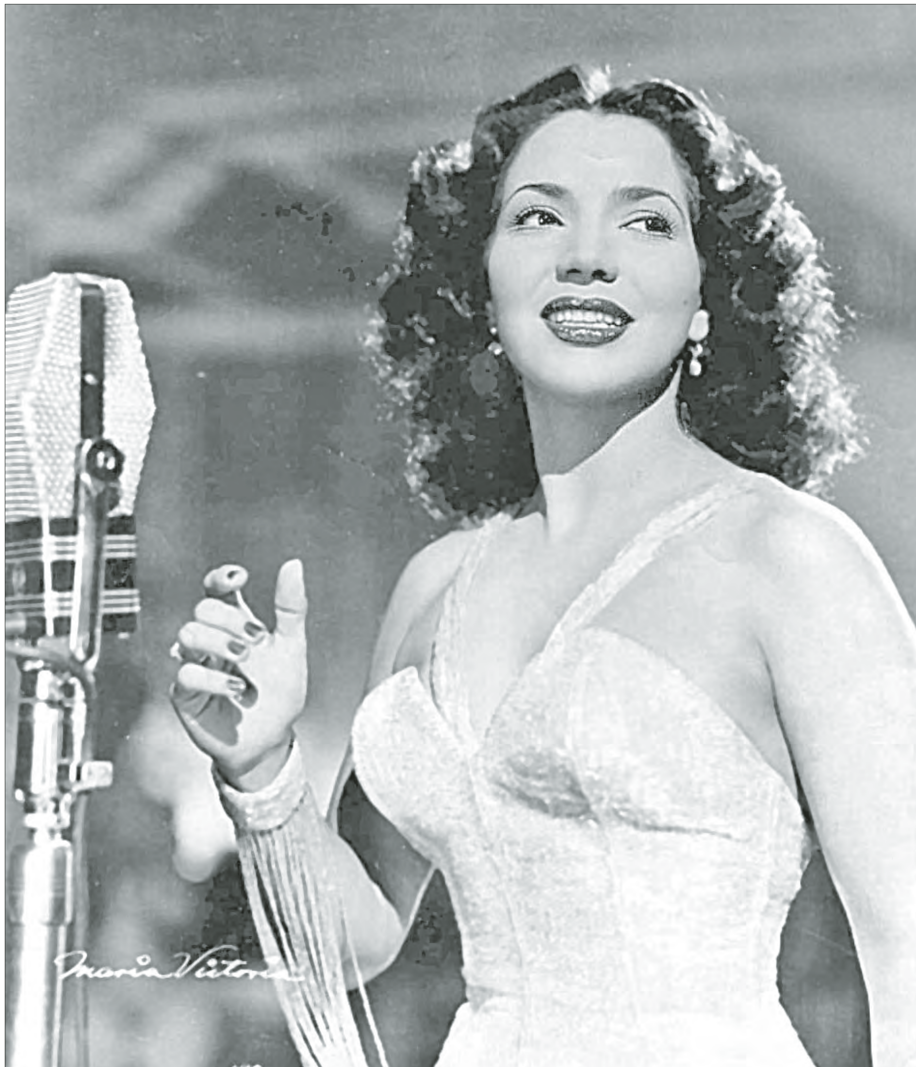
FIGURA DEL CINE nacional, María Victoria celebrará su cumpleaños 103 con un homenaje que le realizará la compañía de cabaret Delirio Tropical, que rendirá tributo a la legendaria actriz y cantante con un espectáculo de gran formato y de acceso gratuito en el Teatro de la Ciudad el próximo 25 de febrero.