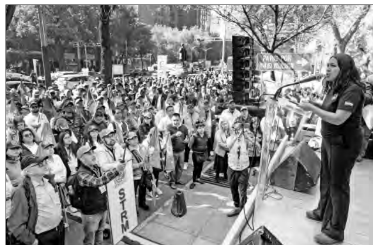
▲ Diversos sindicatos se manifestaron ayer afuera del Senado contra la reforma para reducir la jornada laboral a 40 horas. Aseguran que es “una simulación” sin respaldo del sector obrero, porque no garantiza dos días de descanso y “legaliza la explotación laboral”, al ampliar el número de horas extras con menor pago.

La senadora Anaya propuso adicionar al artículo 123 constitucional otro transitorio, en el que precise también un régimen gradual en el