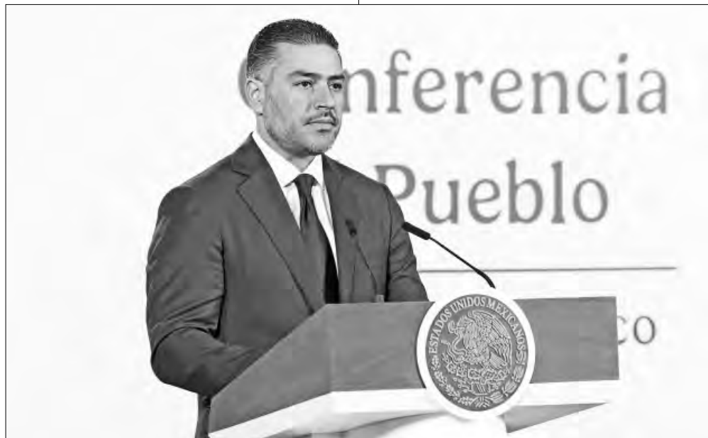
▲ El secretario de Seguridad Pública, Omar García Harfuch, durante la conferencia de la presidenta Claudia Sheinbaum, donde se