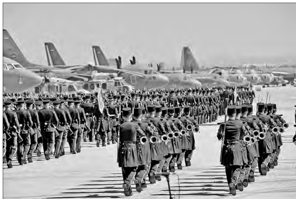
▲ Ceremonia por el 111 aniversario de la Fuerza Aérea Mexicana ayer en la Base

LA EXHIBICIÓN DE las presuntas intimidades sucias de la gobernanza 4T (incluso lo relacionado con el caso de Sergio Carmona, reputado como rey del huachicol y presunto financista de campañas electorales guinda, luego asesinado) abona y sirve al momento de disonancias internas del morenismo, de retos a la presidenta Sheinbaum por parte de personajes heredados y, sobre todo, de una acometida franca de la oposición a dicha 4T por parte de una oposición aún débil, pero ávida de argumentos que la potencien, y del muy agresivo plan trumpista de confusión, divisionismo y traiciones en México para anexarlo de facto al corolario Trump. ¿Ni venganza ni perdón? ¡Hasta mañana!