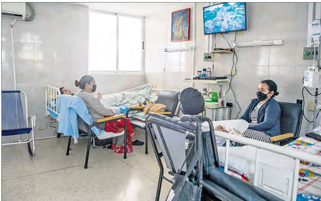
►► El Instituto de Oncología y Radiobiología es el centro rector para el tratamiento, investigación y cura del mal en Cuba, y sufre carencias debido al cerco impuesto por Trump.

Según la doctora Forteza Saéz, “la situación es muy grave en estos momentos. Ya lo era en cuanto a la adquisición de insumos y medicamentos. Pero ahora se recrudece y se complica con otros aspectos. Para los pacientes (como para nuestros trabajadores), el transporte y la alimentación son un problema. La falta de combustible los ha agravado. Los pacientes oncopediatricos