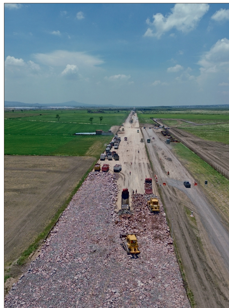
▲ Se han liberado 2 millones 262 mil 658 metros cuadrados, que comprende 425 predios.

De igual manera, dos complejos eléctricos en Tecámac y Mineral de la Reforma; una base de mantenimiento en Zapotlán y un taller y cochera Mineral de la Reforma, detalló el general de Brigada, Ricardo Vallejo Suárez.