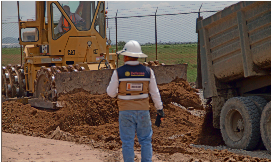
▲ Originalmente, el plan de infraestructura ferroviaria estaba previsto para ser entregado en el 2029.

En el marco de las Rutas de la Transformación y la Feria de Servicios, donde el ejecutivo estatal realizó la entrega simbólica de diversos apoyos sociales, calificó esta noticia como una “posibilidad enorme de