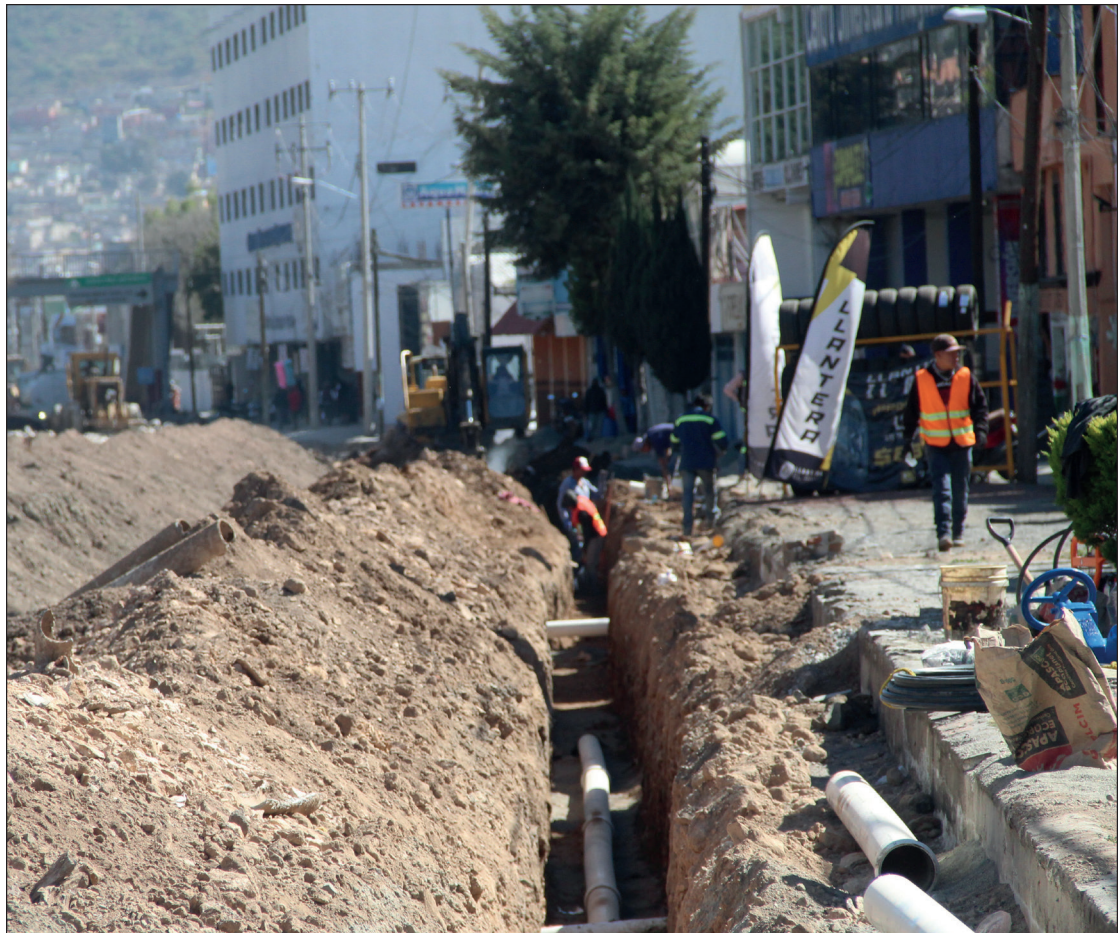
▲ La Contraloría afirmó que el señalamiento del organismo autónomo se refiere a la necesidad de ampliar información sobre el proceso de adjudicación de la construcción de una barda.