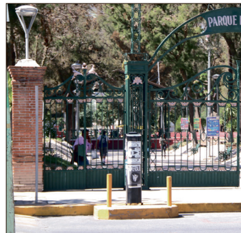
▲ Una de las muestras que está en pláticas avanzadas para esta galería es una del Festival Internacional de la Imagen (FINI).

En cuanto a la agenda cultural para los siguientes meses del año, mencionó que durante febrero se