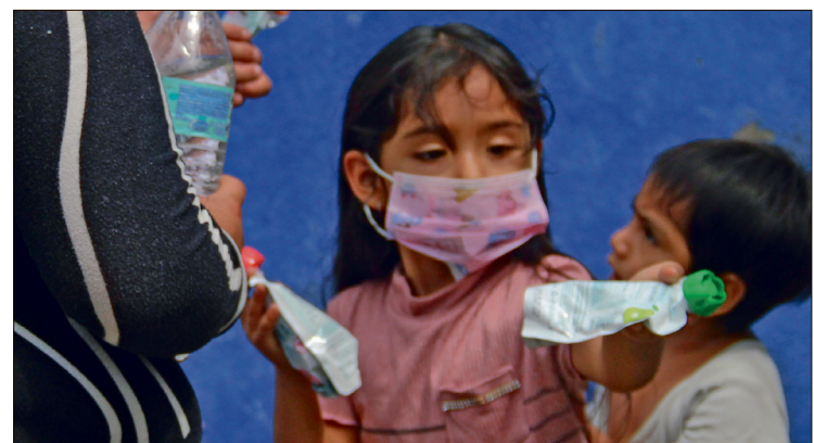
▲ Ante la reciente aparición de casos de sarampión, la ciudadanía ha comenzado a retomar voluntariamente esta medida preventiva.

La Secretaría de Salud ha reiterado que la medida más efectiva para “frenar de tajo” el avance del sarampión es verificar y completar los esquemas de vacunación, haciendo un llamado urgente a los padres de familia para proteger a los menores de edad.