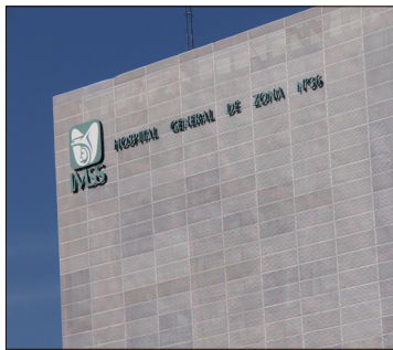
▲ La respuesta de personal de la Clínica 36 del IMSS fue que existen, al menos, 900 pacientes en la misma situación.

colo institucional incluye atención psicológica para que el paciente entienda que la toma debe ser “a la hora precisa, ni un minuto antes ni un minuto después”, rigor que ahora se ve roto por la falta de suministro en el IMSS.