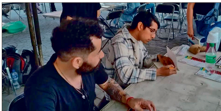
▲ El proyecto nació como un espacio seguro para acercarse a las letras.