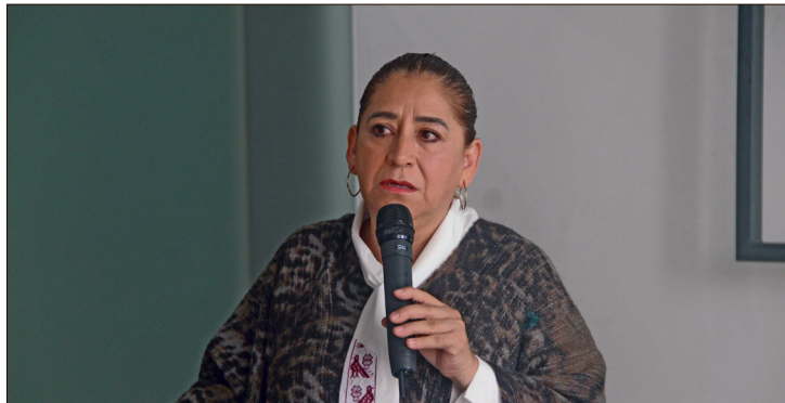
▲ La secretaria de Turismo celebró que Huapalcalco fuera incluido en el paquete de rescate patrimonial anunciado por el gobierno federal.

“Queremos preparar a guías y por eso hemos hecho dos diplomados de 550 horas cada uno que te acredita como guía de turistas cultural en esa zona, tenemos 100 guías de turistas acreditados y todos los años hay un curso de guía de turistas”, aseguró Quintanar.