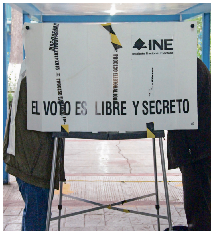
▲ De acuerdo con el informe del Instituto Nacional Electoral (INE), la entidad fue la que más se vio afectada con dicho recorte, seguida de Colima, con 52.91%; y Morelos, con 42.21%.

Así como 132 millones 746 mil 552 pesos para financiamiento público, de un presupuesto total autorizado por 232 millones 546 mil 827 pesos, en virtud de un recorte de 34 millones 501 mil 623.57 pesos.