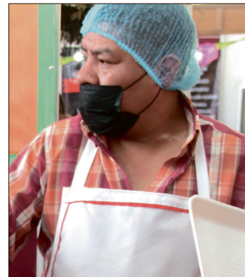
▲ La medida se debe al incremento de casos probables y confirmados de sarampión en la región Tula-Tepeji y municipios aledaños.

A mediados de enero, el titular de la SSA, David Kershenobich Stalnikowitz, señaló que el sarampión es un virus mucho más contagioso que la covid-19: mientras una persona con covid puede contagiar hasta a cuatro personas, un enfermo de saram-