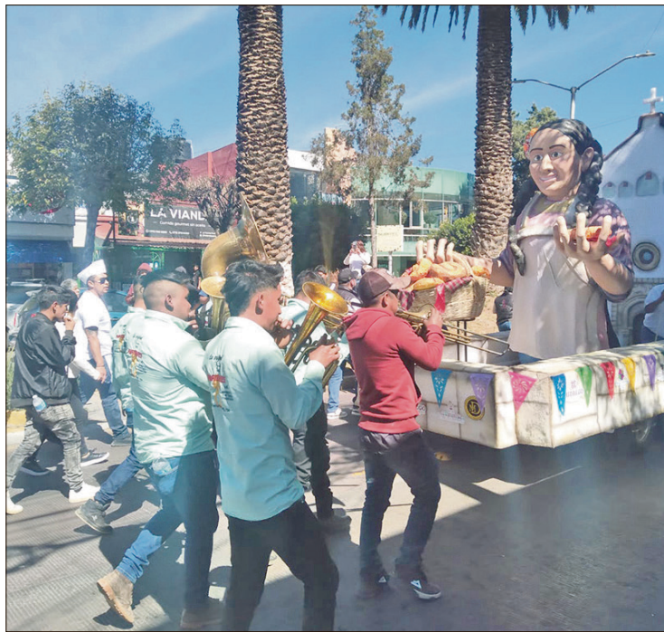
▲ Participaron 42 comparsas provenientes de 42 municipios; 29 bandas de viento y 10 carros alegóricos.

Tras cruzar varias calles de la capital, el “alegre desorden” desembocó finalmente en la Plaza Juárez, donde la fiesta visual se transformó en un banquete para los sentidos.