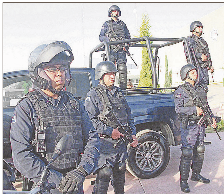
▲ Responden a la necesidad de alinear el marco local con las reformas estatales y federales en seguridad, medio ambiente y protección civil.

En Santiago Tulantepec, el nuevo bando sustituye al de 2019, logrando una alineación directa con las metas establecidas en el Plan Municipal de Desarrollo. Esta actualización busca que la normativa