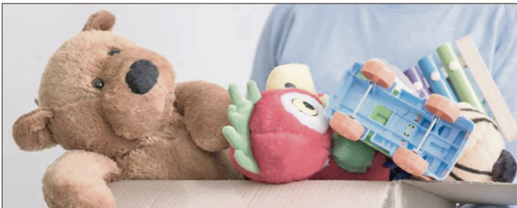
▲ Los juguetes serán utilizados en el taller de contención emocional llamado “Mi peluche, mi amigo”.

Asimismo, se ha puesto a disposición el número de WhatsApp 775 102 99 25 para brindar mayores informes a quienes deseen colaborar con esta campaña de impacto social.