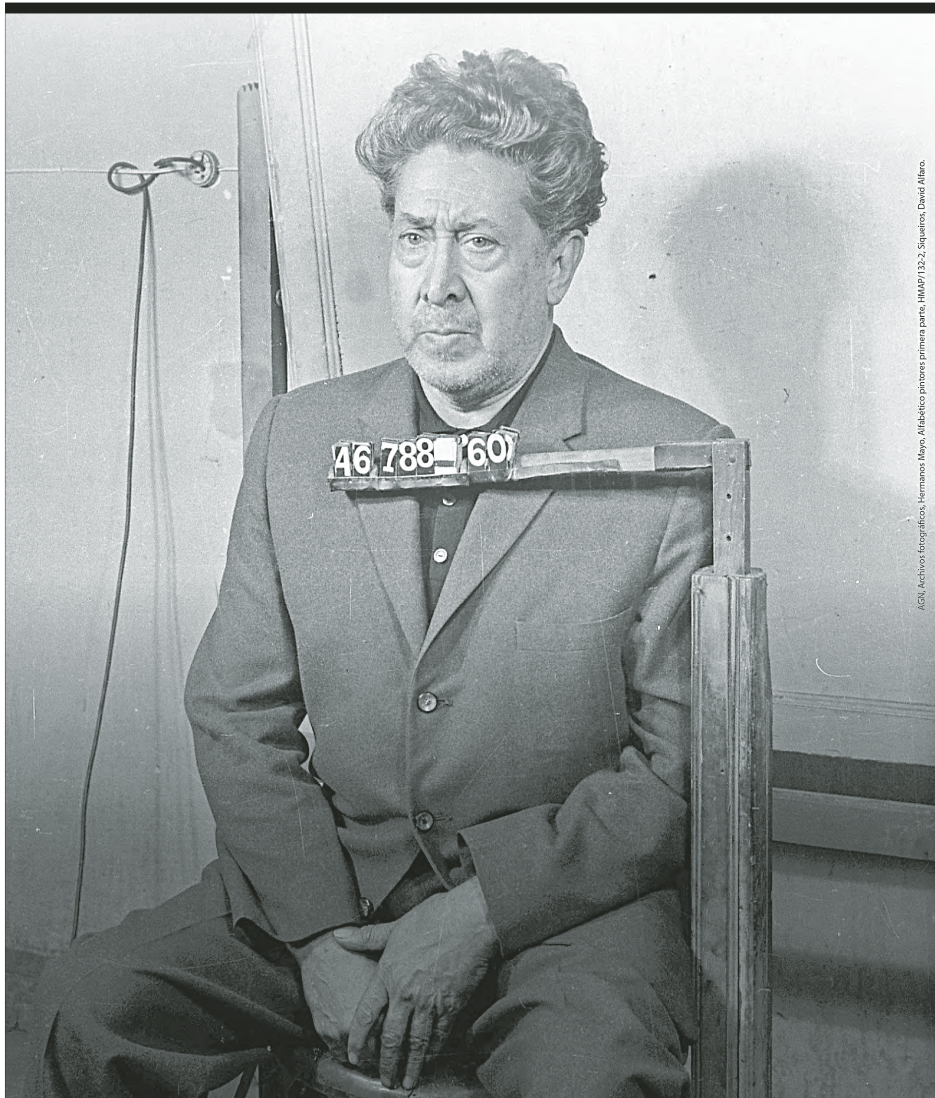
Siqueiros, David Alfaro.

LA EXPOSICIÓN Encarcelar la llamada se presentará a partir del 4 de febrero en la Biblioteca Teresita de Barbieri del Instituto de Investigaciones Sociales de la UNAM. En ella se ofrecerá una lectura cronológica y temática de momentos de la vida del artista y activista, que están “íntimamente ligados con sus diversos ingresos a la prisión de Lecumberri, así como a la vida política y social del país”. El recorrido