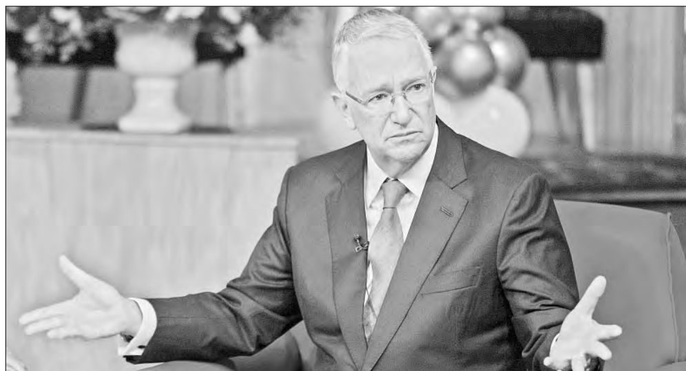
▲ Ricardo Salinas Pliego, presidente del conglomerado de empresas Grupo Salinas,

en el programa de espectáculos Ventaneando, de Tv Azteca.