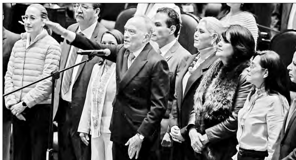
▲ La Comisión Permanente del Congreso de la Unión ratificó ayer al ex fiscal Alejandro

LA PRESUNTA JUSTIFICACIÓN de fondo, el pretexto fáctico, descansa en el Plan México (neoliberal a cual más) y sus polos de desarrollo que privilegian la inversión, sobre todo extranjera, por encima de cualquier otra consideración. ¡Hasta mañana!