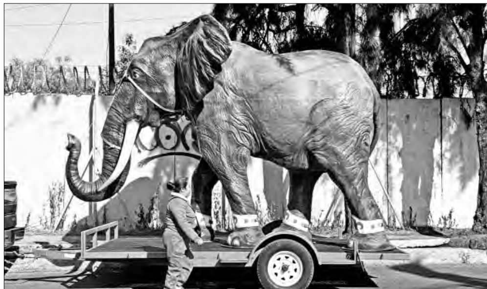
▲ Una escena inusual se pudo observar en calles de la alcaldía Xochimilco, donde una enorme figura de elefante elaborada con fibra

de vidrio era transportada sobre ruedas para promover un evento circense.