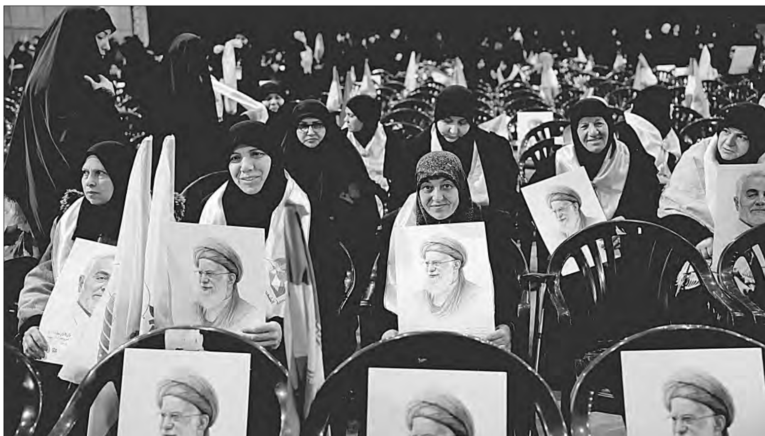
▲ Simpatizantes de Hezbollah portan imágenes del líder iraní, ayatollah Ali Jamenei, en apoyo a Teherán ante el asedio de Washington.

Teherán se alista ante posible ataque // Milicias amenazan con represalias