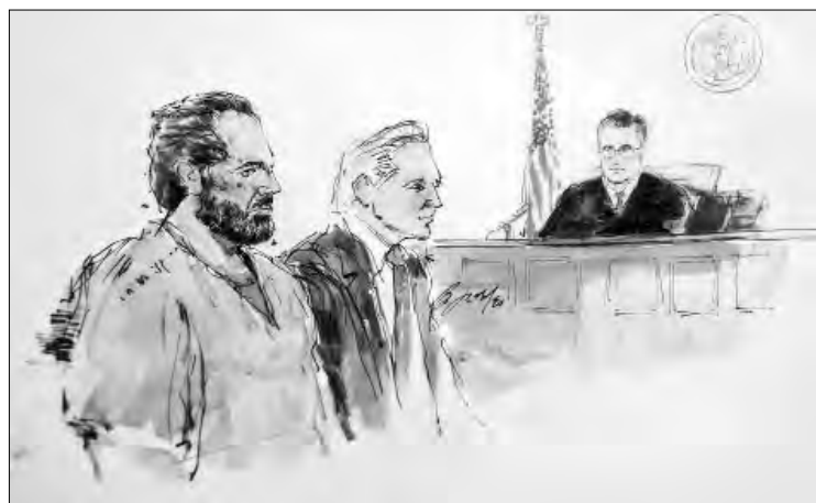
◀ El ex atleta canadiense se declaró inocente en Estados Unidos. La imagen, durante la audiencia de ayer.

El 11 de febrero está programada una revisión de su caso y el 24 de marzo empezará su juicio.