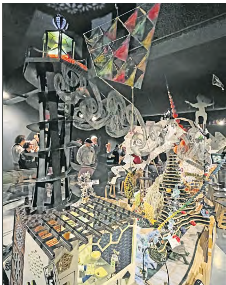
▲ La instalación MatemAlquimia fue creada durante la pandemia por un grupo de 24 artistas y matemáticos.

el trineo con perros les ayudan a restaurar sus cuerpos, beneficiar su salud mental, combatir la soledad y mejorar su autoestima.