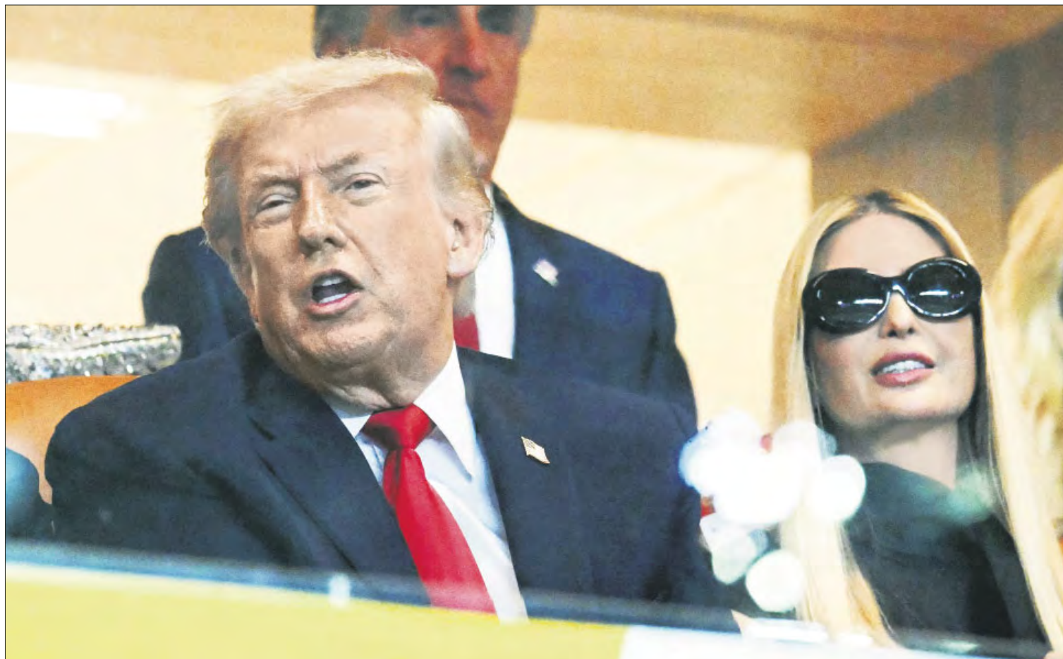
▲ El presidente de Estados Unidos, Donald Trump, y su hija, Ivanka Trump, asistieron al partido por el Campeonato Nacional de Fútbol Universitario entre Miami Hurricanes e Indiana Hoosiers, en el Hard Rock Stadium, en Miami Gardens, Florida.

Aunque el gobierno de Trump reporta que su magno esfuerzo está dedicado a detener y deportar a “criminales”, la mayoría—entre dos tercios y tres cuartas partes—no tienen