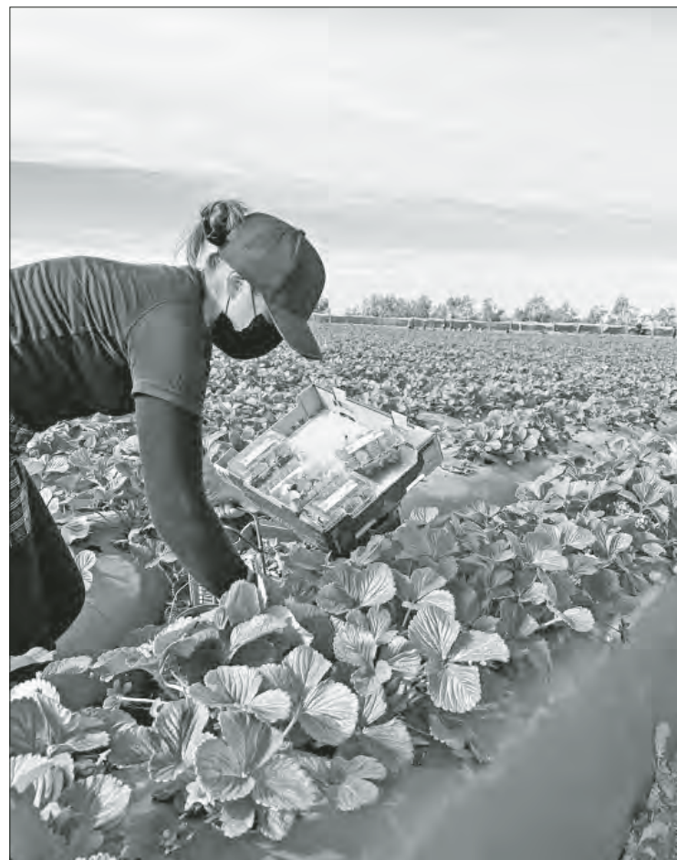
▲ Una jornalera agrícola cosecha fresas en uno de los campos de San Quintín, Baja California, donde persisten condiciones de explotación laboral.

cada jornalero un porcentaje de las percepciones que recibe por su mano de obra a destajo, y por el costo de trasladarlo. Su jornal es de ocho horas y se puede extender a 12 o 13, a solicitud de los mayordomos.