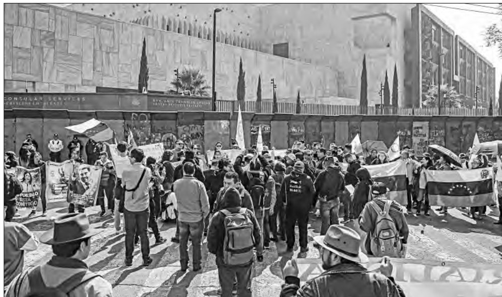
▲ Frente a la embajada de Estados Unidos en la capital, manifestantes contra las políticas de Donald Trump convocaron a la población a no consumir productos de marcas de ese país

X, Facebook, TikTok, Instagram: galvanochoa Correo: galvanochoa@gmail.com