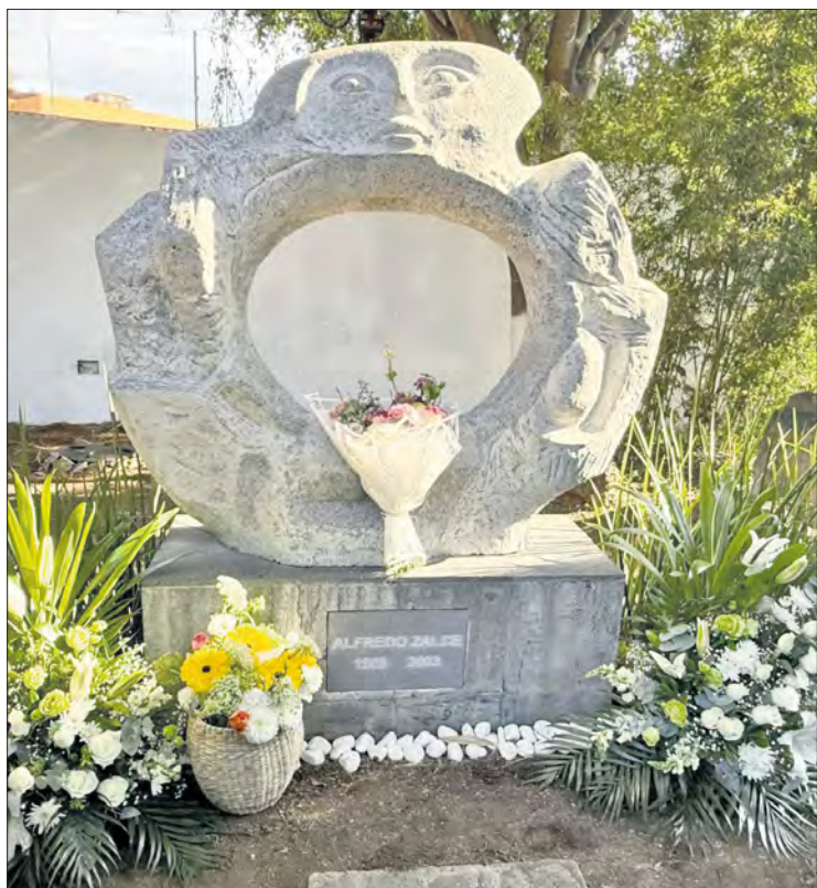
▲ Réplica de la pieza La Luna , de Alfredo Zalce, ubicada en la casa-taller del artista, en Morelia, Michoacán.

La exposición estará por un mes y formará parte de la oferta cultural del Museo Marco en Monterrey, cuya cartelera se puede consultar en las redes sociales de ese recinto cultural.