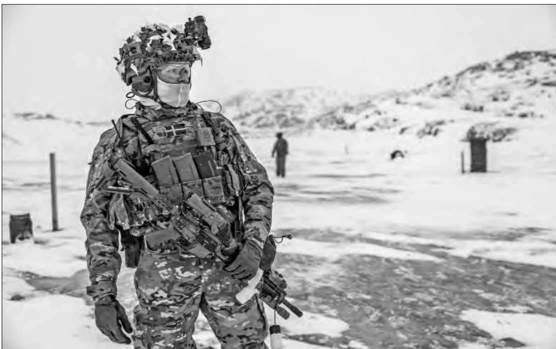
◀ El gobierno danés incrementó la presencia de sus fuerzas armadas en el territorio ártico.

En sus redes sociales, Trump aseveró antenoch que “la Organización del Tratado del Atlántico Norte (OTAN) lleva 20 años diciéndole a Dinamarca que ‘tiene que alejar la amenaza rusa de Groenlandia’. Por desgracia, Dinamarca no ha sido capaz de hacer nada al respecto. ¡Ha llegado la hora, y se hará!”