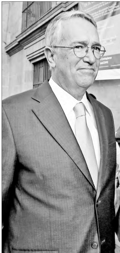
▲ Ricardo Salinas Pliego, presidente y director general de Grupo Salinas, tiene esta semana para saldar sus adeudos con el fisco mexicano.

X: @cafevega Correo: cfvmexico_sa@hotmail.com