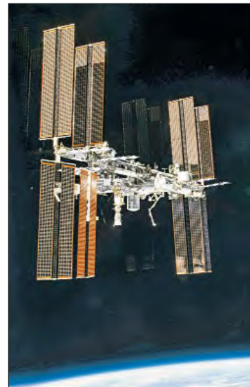
▲ Estación Espacial Internacional vista desde el transbordador Atlantis en 2011.