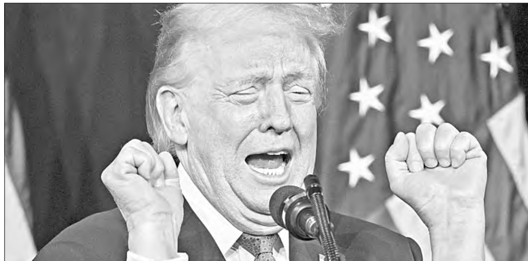
▲ El Senado de Estados Unidos aprobó una resolución que prohíbe al presidente Donald Trump emprender más acciones militares contra Venezuela sin autorización del Congreso.