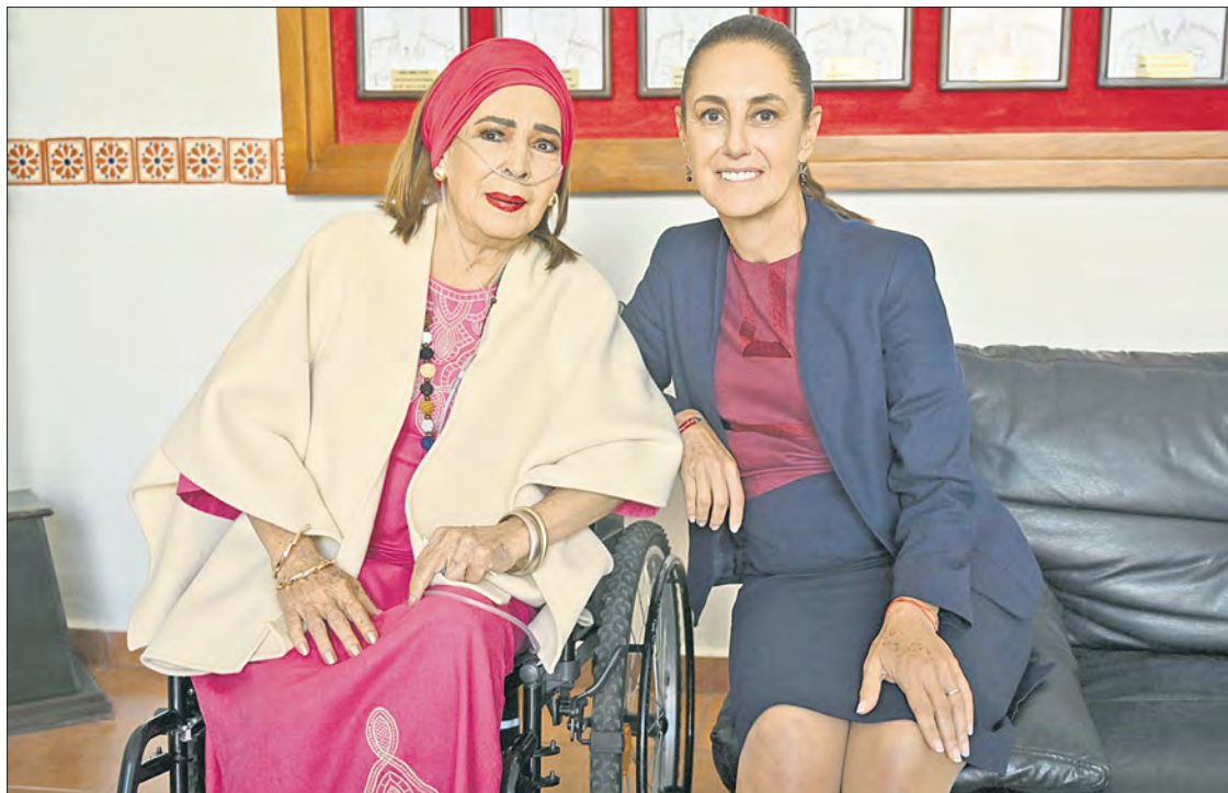
▲ En el marco de su gira, la presidenta Claudia Sheinbaum Pardo se reunió, en Morelos, con la actriz Elsa Aguirre, ícono del cine de oro mexicano. “Es un ejemplo de gran fortaleza”, consideró la mandataria.