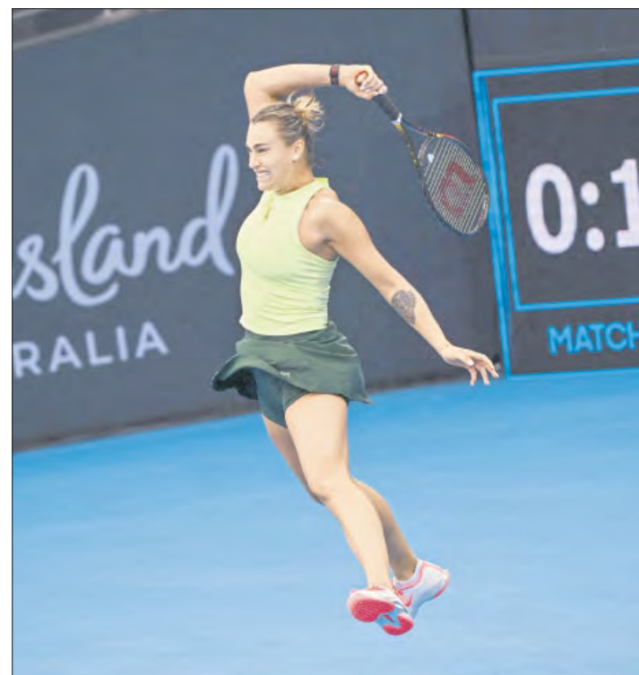
▲ La bielorrusa derrotó ayer a la rumana Sorana Cirstea y avanzó a cuartos de final del Brisbane International.

“Siempre es bueno comenzar el año con un poco de drama”, dijo la estadounidense en una entrevista posterior al partido después de tres horas en la cancha.