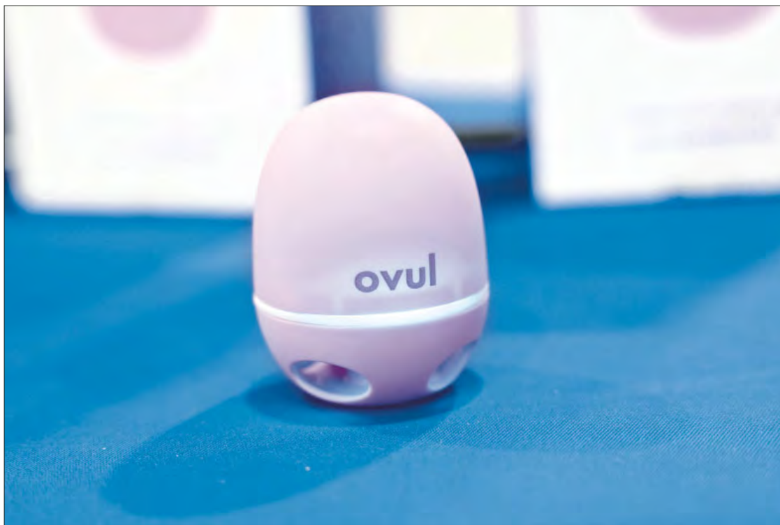
◀ El rastreador de hormonas y fertilidad basado en saliva, OVUL, se exhibe en el pabellón de tecnología de Ucrania durante la feria anual Consumer Electronics Show (CES).