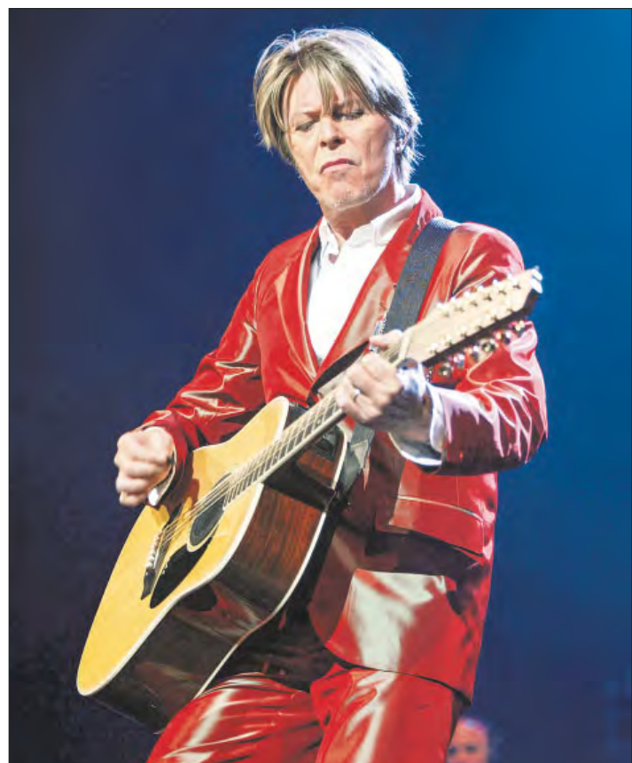
▲ Ayer fue el aniversario natal de David Bowie, quien cumpliría 79 años. Nacido el 8 de enero de 1947 en Brixton, Londres, el músico era conocido por su estilo innovador. Algunos de sus éxitos más icónicos incluyen Space Oddity , Changes , Ziggy Stardust y Heroes .