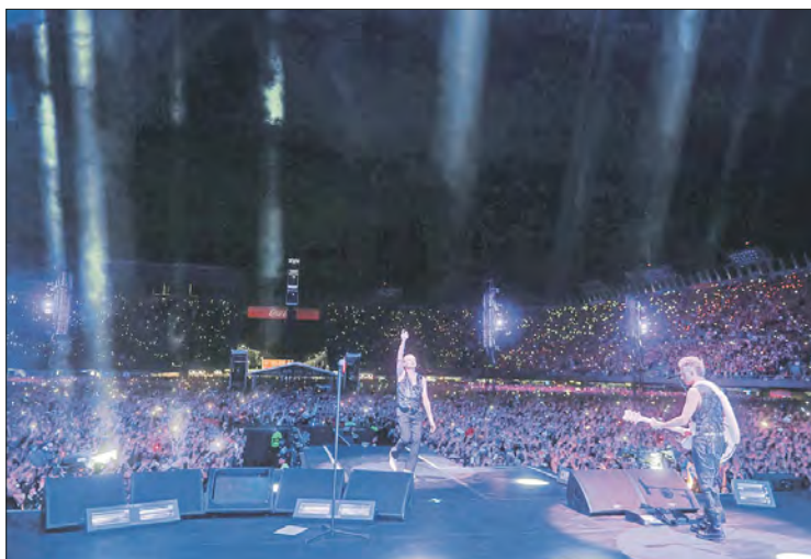
◀ Fotogramas del documental de la banda británica que presenta imágenes inéditas de Memento Mori World Tour

El documental Depeche Mode: M no sólo celebra la música de una de las bandas más influyentes de la historia moderna, sino que también ofrece un relato cinematográfico sobre cómo el arte puede unir, recordar y transformar.