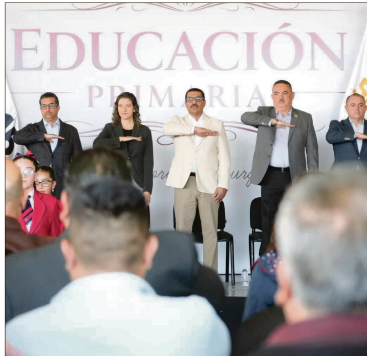
▲ El pronunciamiento tuvo lugar durante la conmemoración, por primera vez, de la creación del Nivel de Educación Primaria, evento donde se reconoció la importancia de este sector.

Durante el acto fue reconocida la labor del sector educativo más grande y con mayor presencia en el país. La ceremonia contó con la participación de autoridades educativas y sindicales, quienes resaltaron la importancia histórica y simbólica de este nivel como pilar fundamental de la sociedad mexicana.