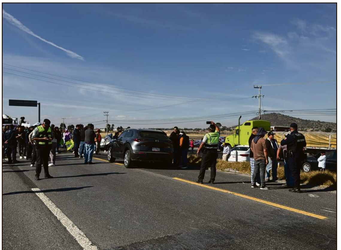
▲ Previo a su localización, familiares de la adolescente realizaron un bloqueo en la carretera México–Pachuca, a la altura del municipio de Tolcayuca, como medida de presión.

Tras un trabajo de inteligencia operativa, análisis de datos y el uso de herramientas tecnológicas de videovigilancia, la menor fue ubicada en un domicilio, donde se encontraba con la persona que presuntamente la había sustraído de manera ilegal. La SSPH destacó que estas acciones priorizan la integridad de niñas, niños y adolescentes, así como el acompañamiento a sus familias.