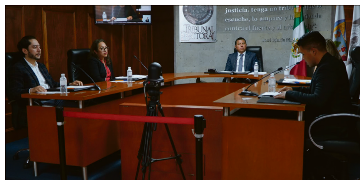
▲ Regidores acusan la interrupción reiterada de sus participaciones en las asambleas.

No obstante, el Tribunal declaró que al ser una conducta reiterada de la presidenta municipal la omisión de acompañar la convocatoria con la respectiva documentación soporte de los puntos en el orden del día, se impuso como medida de apremio, la amonestación pública.