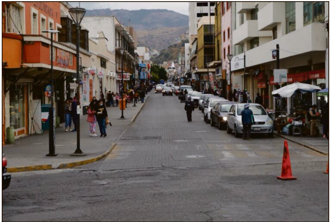
▲ La capital de Hidalgo está dentro de las 23 áreas urbanas del país que experimentaron un incremento significativo.

de inseguridad: En contraste, las zonas donde la población se siente más segura son San Pedro Garza García (8.7%), Benito Juárez (14.8%), Piedras Negras (17.3%),