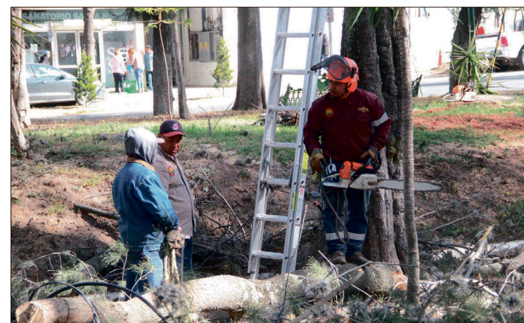
▲ Hay riesgo a causa de la infestación de plagas como el gusano descortezador y el heno motita.

Asimismo, indicó que desde noviembre comenzaron los trabajos de tala y retiro de árboles en mal estado como parte de una estrategia preventiva para evitar accidentes.