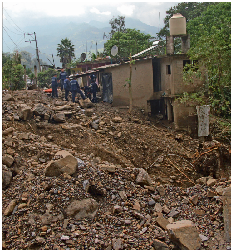
▲ Con un patrimonio que ha pasado por casi tres generaciones, vecinos del municipio se resisten a perder sus viviendas.

Ambos afectados coincidieron en que, si bien no se niegan a una reubicación, no pueden salir de sus viviendas debido a que no tienen a dónde ir y las autoridades no les han informado sobre el tema.