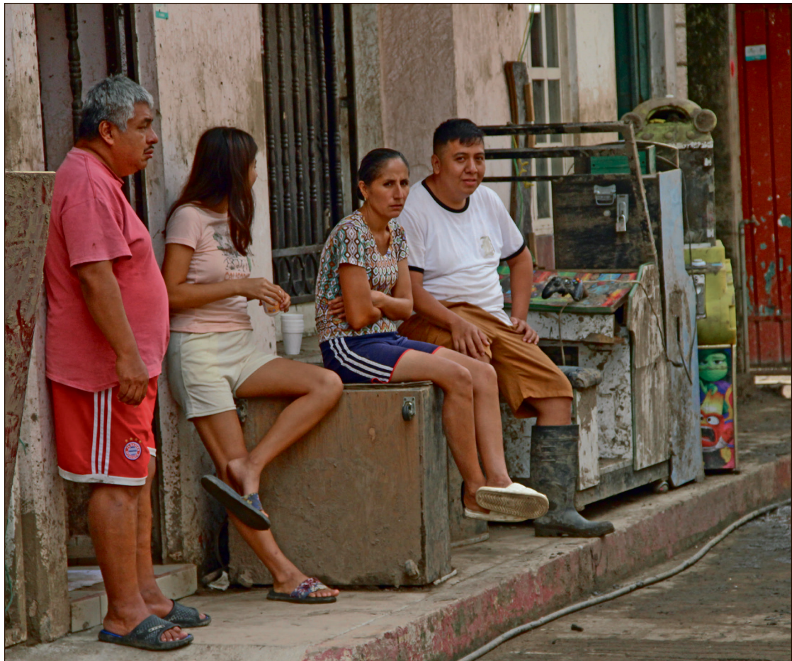
▲ Actualmente algunas familias buscan regresar a sus hogares ante la falta de información sobre a dónde serán reubicadas.

ENTRE 150 O 170 PERSONAS REGRESARON: REPRESENTANTE