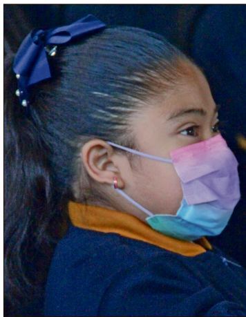
▲ La secretaria de Salud pidió no enviar a clases a niñas y niños con síntomas respiratorios sin valoración médica.

nuda sin cubrebocas, automáticamente puede contagiar al resto. Es muy importante que quienes tengan escurrimiento nasal, tos o dolor de cabeza utilicen cubrebocas y se resguarden”, enfatizó.