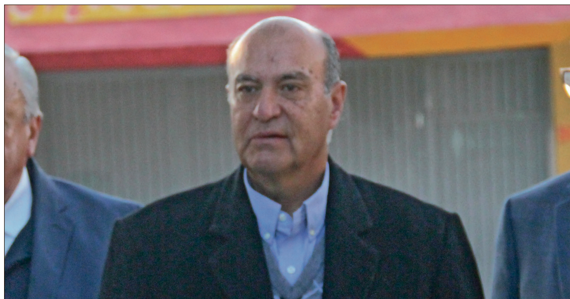
▲ Lo que se ha enviado hasta el momento es apoyo en especie, proveniente tanto del ámbito estatal como federal: Castrejón.

Sobre la rehabilitación de los planteles con mayores afectaciones, explicó que se trabaja de manera coordinada con el Instituto Hidalguense de la Infraestructura Física Educativa (Inhife) y su instancia na-