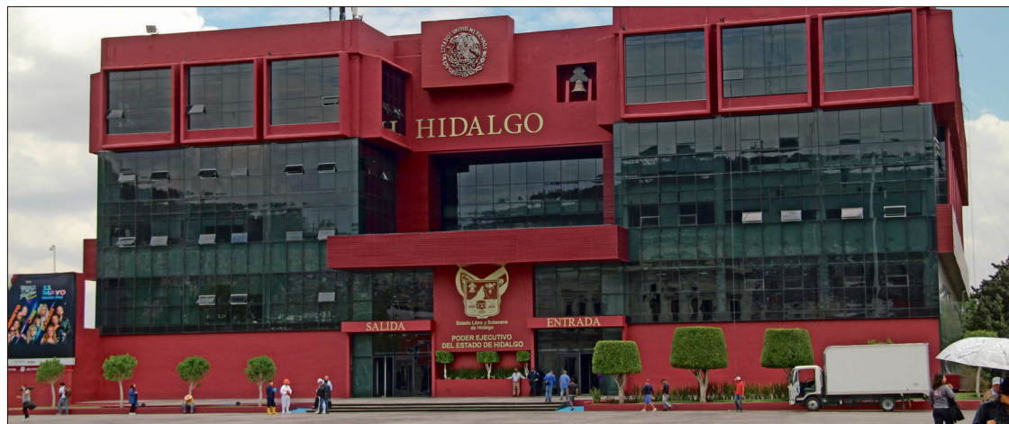
▲ La Contraloría del estado mantiene en constante revisión el Padrón de Proveedores y Contratistas para verificar que cumplan con los requerimientos.

Por otra parte, a Servicios Inmobiliarios Iroa S.A. de C.V. se le canceló su registro por incumplimien-