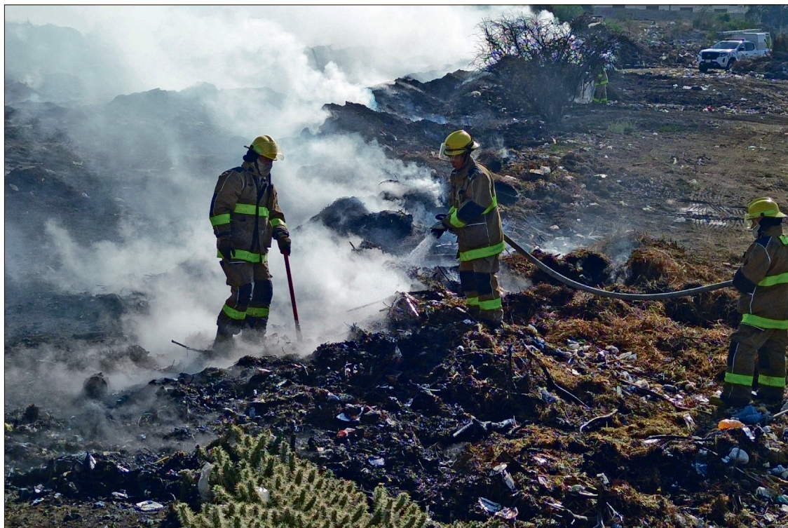
▲ La temporada de incendios forestales inicia formalmente en marzo y se intensifica entre abril y mayo.