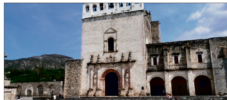
▲ Hidalgo cuenta con una amplia red de conventos del siglo XVI.

Añadió que el INAH también trabaja en proyectos para mejorar la conservación y museografía de otros inmuebles bajo su resguardo, como los conventos de Actopan, Epazoyucan, Tepeapulco y San Francisco, donde se prevé realizar intervenciones por etapas en coordinación con autoridades municipales, agrupaciones civiles y comunidades religiosas.