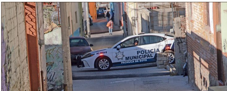
◀ Las acciones se mantienen de manera permanente, principalmente en el primer cuadro de Pachuca, explicó el titular de Seguridad.