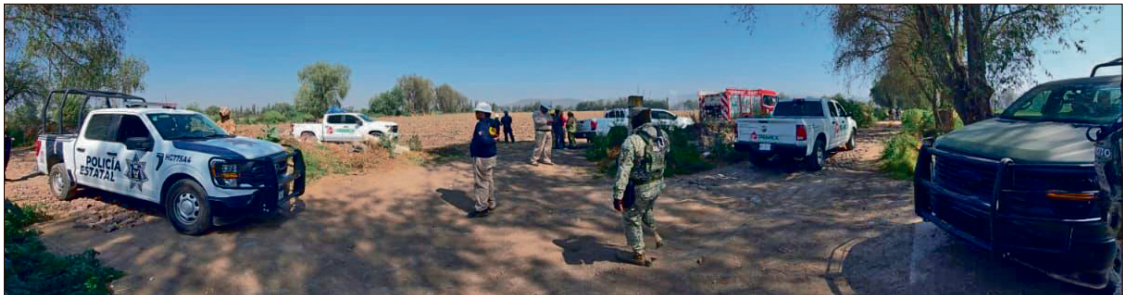
▲ Personal especializado de Pemex acudió al lugar para realizar las maniobras necesarias que permitieron controlar el chorro de hidrocarburo, que fue visible a varios metros de distancia.

motivó la movilización de elementos de Protección Civil de Tlahuelilpan y Atitalaquia, así como de la Secretaría de Seguridad Pública estatal y municipal.