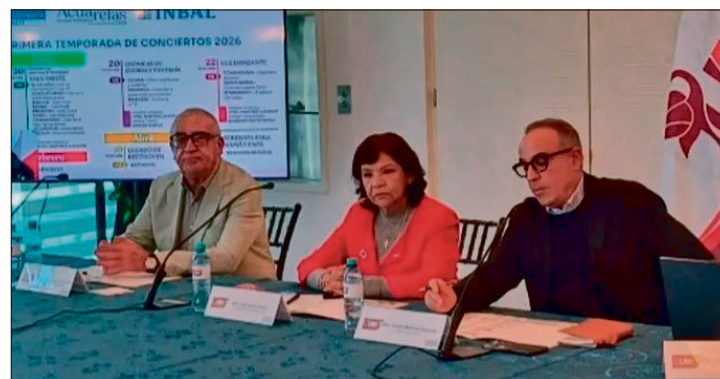
▲ Durante mayo y junio, la orquesta recibirá a destacados solistas internacionales.

Todos los conciertos se llevarán a cabo los días viernes a las 19:00 horas, en el Aula Magna Alfonso Cravioto Mejorada del Centro de Extensión Universitaria (CEUNI). La programación es apta para toda la familia.