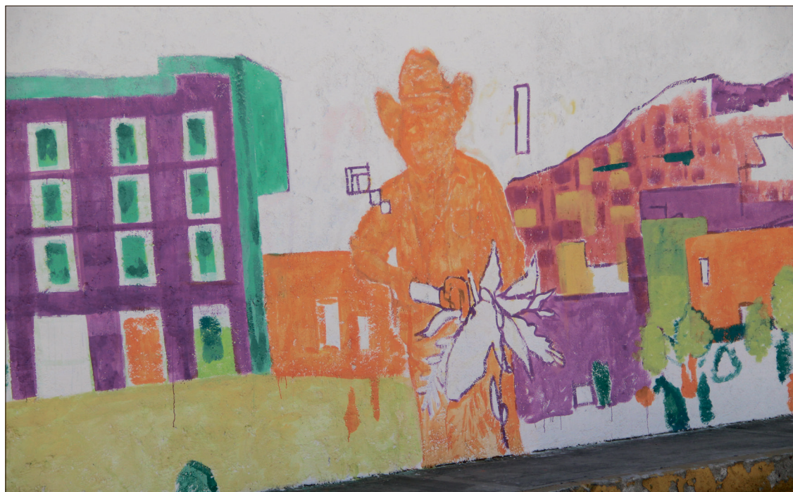
▲ Uno de los ejes prioritarios será el fomento a la lectura, a través de un nuevo programa que acompañará las Rutas de la Transformación del gobernador Julio Menchaca Salazar.