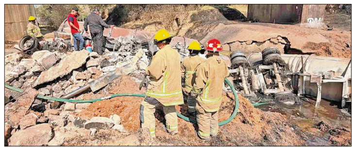
▲ El siniestro ocurrió exactamente en el kilómetro 109, a la altura de la comunidad de Santa María Asunción y cerca de la caseta de San Alejo.

Denuncian daños estructurales en sus casas y una grave contaminación en sus fuentes de agua y suelos