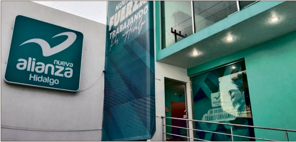
▲ Nueva Alianza Hidalgo señaló que el traspaso de los recursos a una cuenta de deudores diversos ya es investigado por las autoridades competentes.

En el recurso de apelación, los magistrados coincidieron en la multa impuesta por el máximo órgano electoral de imponer una