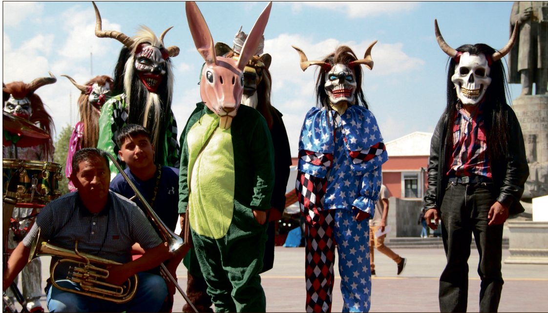
▲ El año pasado acudieron cerca de 2 mil personas en las comparsas, cifra que esperan igualar o incluso superar este año.