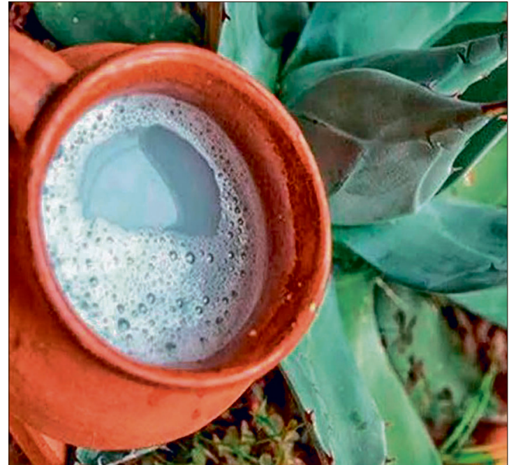
▲ El pulque es una bebida ancestral vinculada con los dioses y las culturas prehispánicas.

“Se reconoce la función del maguey como parte fundamental de la sustentabilidad, toda vez que contribuye a la conservación de los suelos; fortalecer un símbolo de nuestra identidad comunitaria, así como a enaltecer y dignificar la actividad del tlachiquero y de todos los que participan en la obtención del aguamiel y su fermentación”, concluyó.