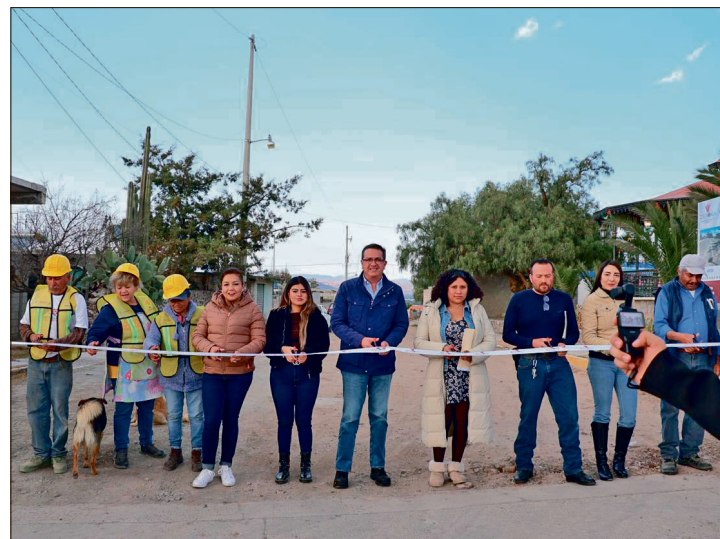
▲ Fueron encabezadas por el alcalde Francisco Sinuhé Ramírez Oviedo.

Con estas acciones, el gobierno municipal, a través de su Secretaría de Desarrollo Urbano y Obras Públicas, reafirma su compromiso de seguir impulsando acciones que atiendan las necesidades prioritarias de las comunidades, especialmente en aquellas que presentan mayores rezagos, avanzando de manera constante en la generación de infraestructura que contribuya al bienestar social y al desarrollo del municipio.