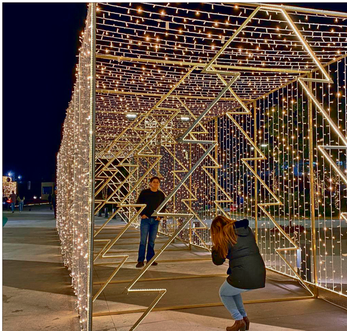
▲ La inversión conjunta realizada en audio e iluminación fue de alrededor de 9 millones de pesos.

Explicó que la intención es desarrollar un pulmón verde con vocación familiar, distinto al Parque Cultural Hidalguense, y estimó que el proyecto podría estar listo entre marzo y abril, para posteriormente analizar la suficiencia presupuestal y, de ser viable, iniciar el proceso de licitación.