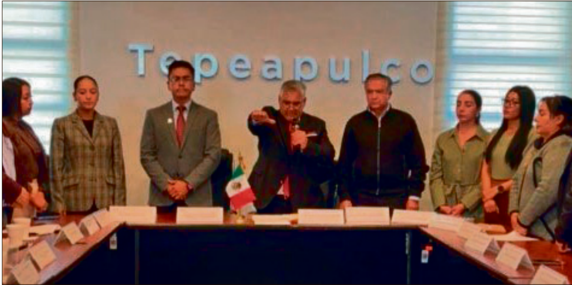
▲ El nuevo alcalde rindió protesta durante la nonagésima sexta sesión extraordinaria.

FUE SUPLENTE OFICIAL EN LOS COMICIOS DE JUNIO DE 2024