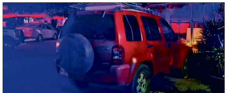
▲ Policías municipales encontraron una camioneta Dodge Liberty color rojo, con placas del Estado de México, en cuyo interior se hallaban los cuerpos.

Con este caso, en los primeros seis días de 2026 suman seis personas ejecutadas en Tula de Allende.