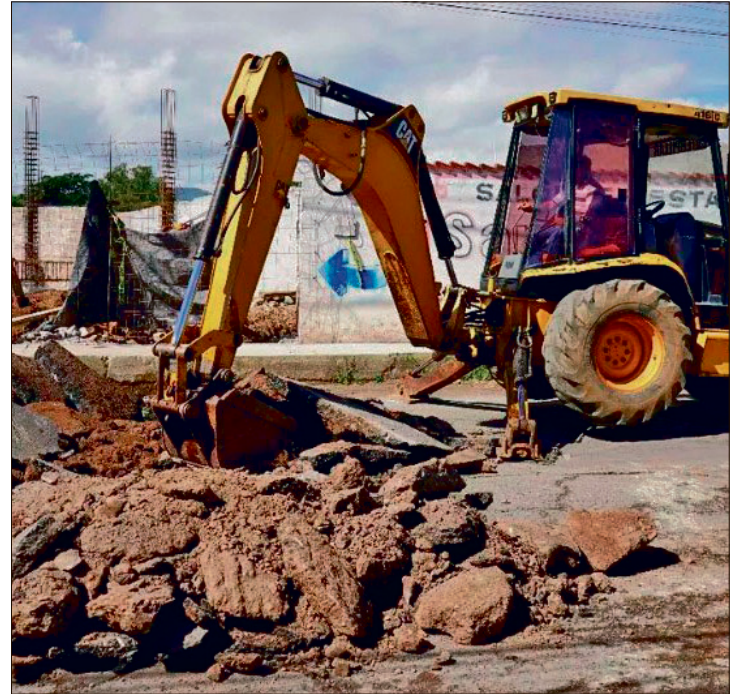
▲ El proyecto cuenta con una inversión de 29 millones 48 mil 769 pesos.

Ante la continuación de las labores con concreto hidráulico, las autoridades locales informaron que próximamente se darán a conocer las rutas alternas para minimizar las afectaciones al tráfico pesado y particular que circula por esta vía clave.