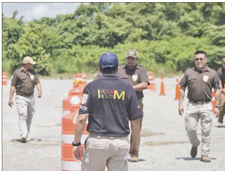
▲ De acuerdo con el estadístico del instituto, noviembre fue el mes con más casos, al reportar 510 regresos; mientras que en octubre sumaron 493 casos.

El número de repatriados es mayor en hombres: de enero a noviembre de 2025 fueron 3 mil 850 casos; de mujeres, 339