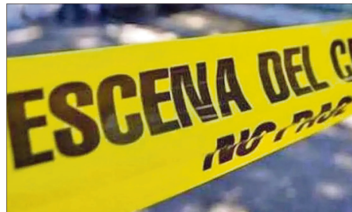
▲ Tres hombres fueron hallados sin vida en la colonia San José, con impactos de arma de fuego; uno portaba un arma tipo escuadra.

Las autoridades no descartan que el hecho esté relacionado con un posible ajuste de cuentas.