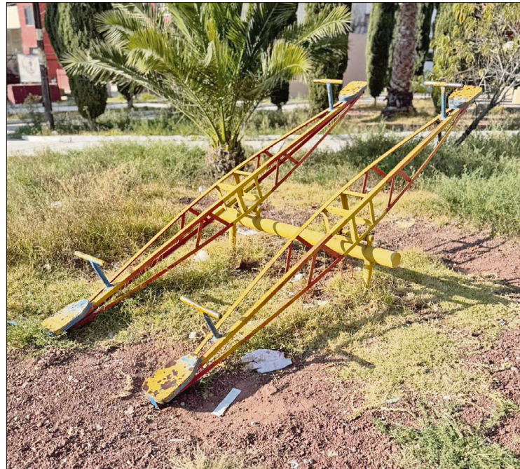
▲ Vecinos de la colonia Cuauhtémoc aseguran que las canchas y áreas recreativas de la zona llevan años en completo abandono y se han convertido en focos de inseguridad y vandalismo.

Si bien reconocieron que en algunas colonias han llegado programas municipales como las “faenas de la transformación”,