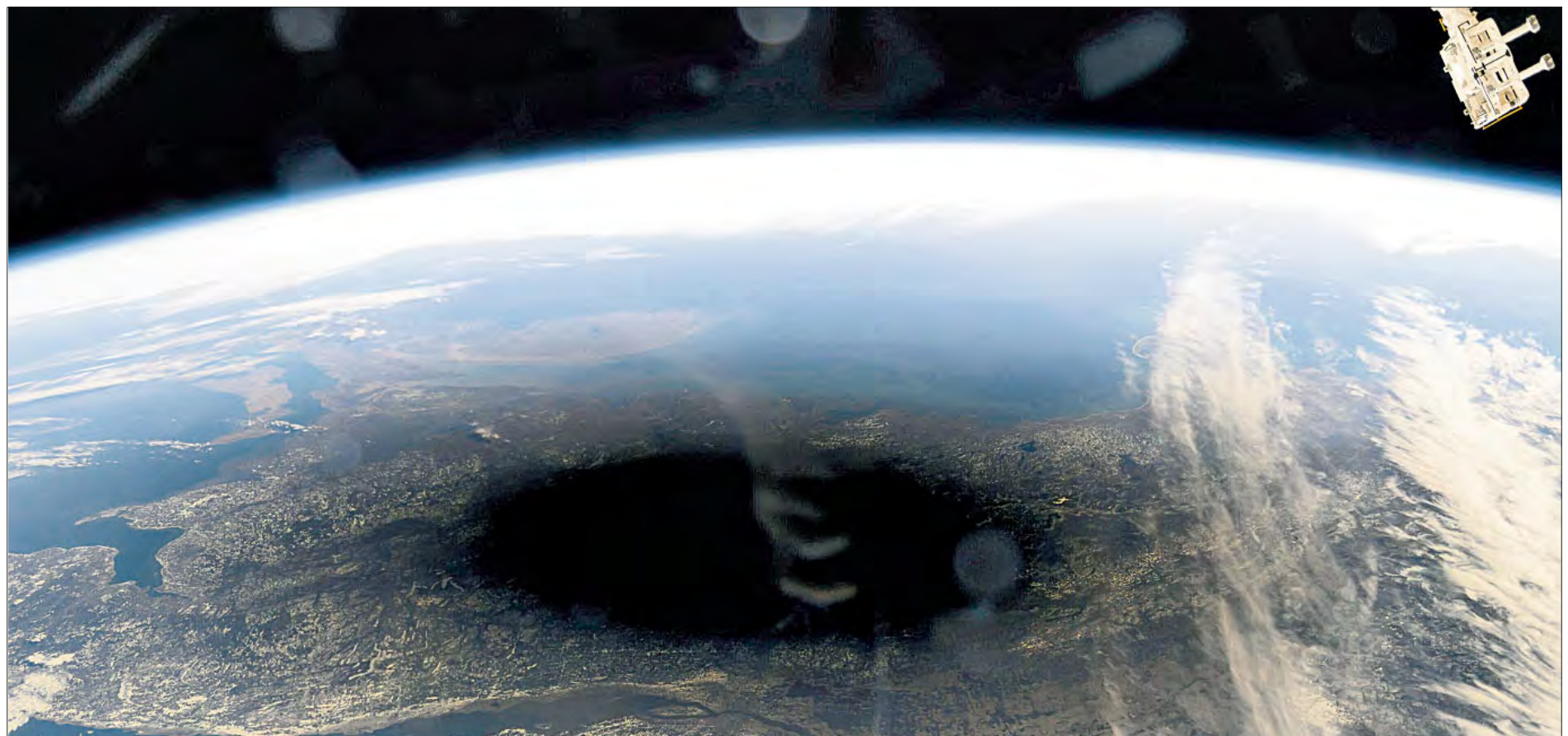
▲ Imagen proporcionada por la NASA que muestra la sombra de la Luna cubriendo partes de Canadá y Estados Unidos durante un eclipse solar total visto desde la Estación Espacial Internacional. Foto Ap