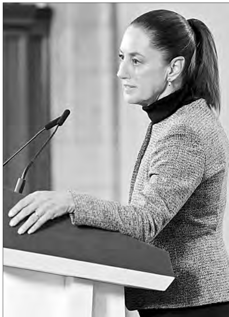
▲ En la conferencia de ayer en Palacio Nacional, la presidenta Claudia Sheinbaum Pardo elogió el desempeño del secretario de Educación Pública, Mario Delgado.

“ Resaltó que nadie es portador de la verdad absoluta en la Cuarta Transformación