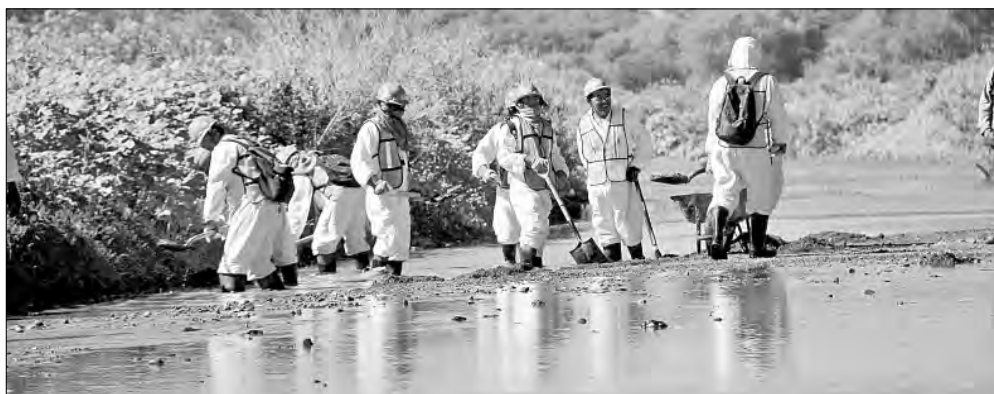
▲ Labores de limpieza en el río Sonora, en agosto de 2014, para neutralizar los ácidos

Twitter: @cafevega cfvmexico_sa@hotmail.com