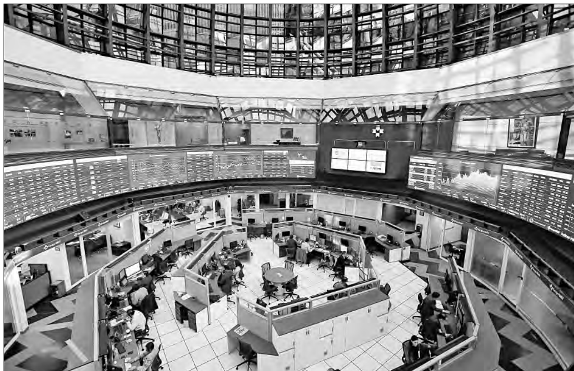
▲ Vista del piso de remates de la Bolsa Mexicana de Valores en junio de 2015.

De acuerdo con el área de análisis de Monex, algunos sectores mantuvieron una inercia favorable de revalorización, en particular las emisoras relacionadas con los metales, como Grupo México y Peñoles, las cuales, junto con Gentera, Cemex y