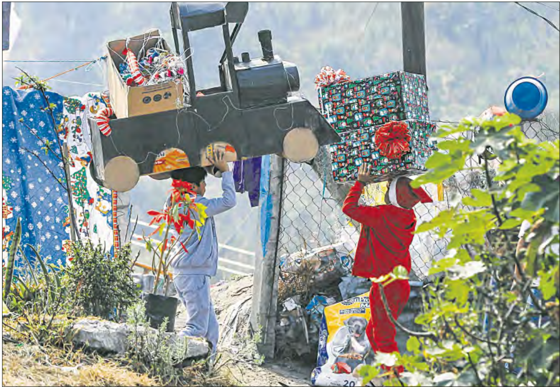
▲ Pequeños disfrutan su asueto con sus propias creaciones.

La comisión agregó que la respuesta de las autoridades ante las denuncias se caracterizó por una actuación deficiente y la victimización secundaria. Expuso que se documentó un patrón de dilación en el Ministerio Público y en la Fiscalía de Personas Desaparecidas al integrar las carpetas. También el Instituto Jalisciense de Ciencias Forenses incumplió protocolos en 11 casos y se comprobó tardanza en los resultados de las confrontas genéticas con personas fallecidas sin identificar, lo cual ha impedido la localización de 54 y el conocimiento de la identidad de los responsables. Asimismo, la Comisión de Búsqueda de Personas de Jalisco suspendió las tareas de rastreo de una víctima por casi dos años. Una parte relevante de la recomendación se refiere a que se acreditó la presunta desaparición forzada en casos específicos con participación policial directa.