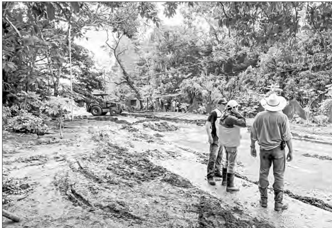
▲► Vecinos explicaron que durante la madrugada el agua se desbordó y ocasionó desastres.

Nahle informó que por lo menos dos viviendas resultaron afectadas. Mientras, la secretaria de Protección Civil hizo un llamado a la población para que se mantenga alerta a los avisos de emergencia relacionados con la temporada de tormentas y huracanes.