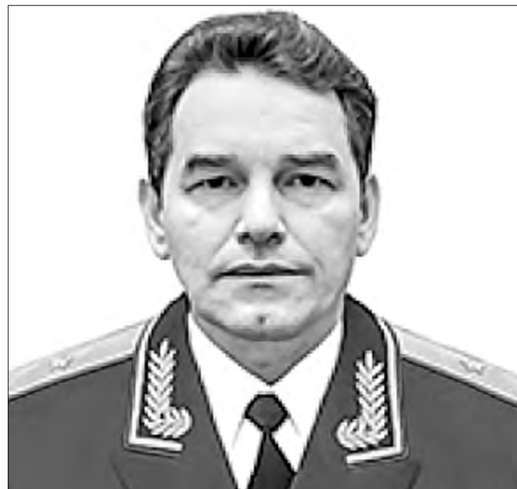
▲▼ El general Fanil Sarvarov fue asesinado cerca de su casa en el sur de Moscú, ayer por la mañana, tras la explosión de una mina adherida a su automóvil.

Entre sus funciones figuraba revisar el nivel de preparación de