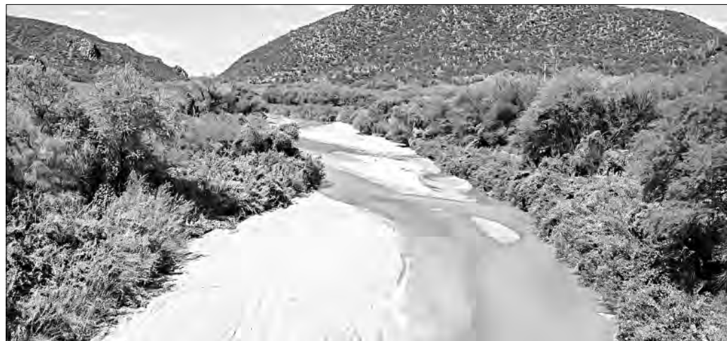
▲ En 2014, el río Sonora fue el destino de un colosal vertido de ácido sulfúrico proveniente

Twitter: @cafevega cfvmexico_sa@hotmail.com