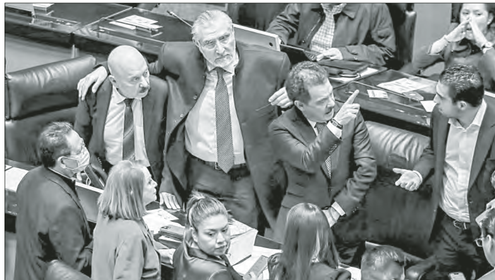
▲ Senadores de Morena y oposición se enfrentaron ayer durante la aprobación de las reformas a la Ley de Salud que prohíben