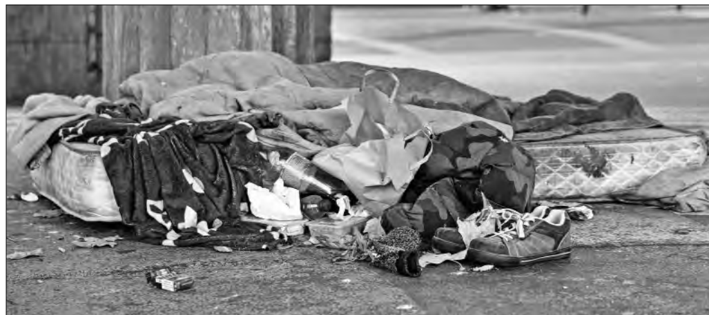
▲ Una persona sin hogar duerme en una calle de París, imagen del primero de diciembre de 2025.