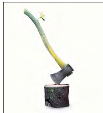
▲ Reproducción de escultura de fibra de vidrio de los artistas Escif y Banksy incluida en la exposición Naixen oliveres a Gaza .

claustro de La Nau, donde la Comunidad Palestina de Valencia ha trabajado junto a Escif en la creación de paneles pintados que visibiliza su voz en primera persona y de manera colectiva.