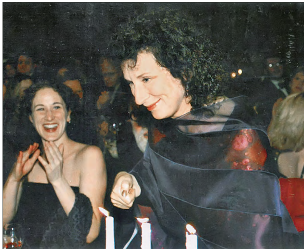
▲ Margaret Atwood en la ceremonia de entrega del Premio Booker por El asesino ciego , en el

Todo escritor sabe que ésa es la verdad. Y todo escritor sabe también que sin la reina malvada o sus avatares —ya sean la invasión alienígena, el huracán, la rompeshogares, el siniestro homicida, las serpientes en el avión o el asesino en la casa de campo—, no hay trama.