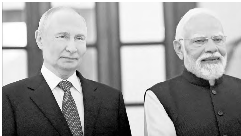
▲ En el encuentro del viernes en Nueva Delhi con el primer ministro indio Narendra Modi, el

http://alfredojalife.com https://substack.com/@jaliferahme https://www.patreon.com/alfredojalife https://www.facebook.com/AlfredoJalife https://vk.com/alfredojalifeoficial https://t.me/AJalife https://www.youtube.com/channel/UCIfxfOThZDPL_c0Ld7psDsw?view_as=subscriber https://vm.tiktok.com/ZM8KnKQn/ X: @AlfredoJalife Instagram: @alfredojalifer