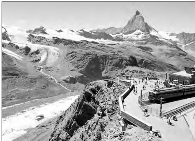
▲ En invierno, la zona se transforma en uno de los mayores centros de esquí de Europa, con pistas que conectan Suiza e Italia y vistas privilegiadas del famoso pico.