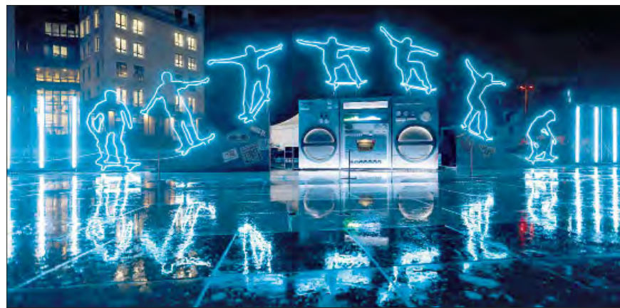
▲ Muestra de arte iluminado creada por el artista visual Remy Bergeron en homenaje a los 40 años de skate en Lyon, como a la vista previa de la edición de las Fête des Lumières en la plaza Louis-Pradel de Lyon, Francia.