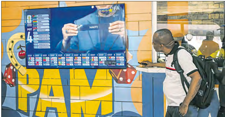
◀ Un aficionado haitiano observa con atención los rivales a los que enfrentará su selección, que vuelve a una Copa del Mundo luego de cinco décadas.

Contra todos los pronósticos debido a las tensiones políticas, Irán y Haití, los cuales son parte de la lista de países con acceso restringido a Estados Unidos, disputarán la fase de grupos del Mundial 2026 en territorio estadounidense. Si bien se esperaba que debido al enfrentamiento diplomático entre Irán y la Casa Blanca, así como el rechazo del gobierno de Donald Trump hacia Haití, ambos países pudieran jugar en Canadá o incluso México, pero el anuncio del calendario oficial del certamen sorprendió al revelar que tendrán como escenario de sus partidos a recintos de Estados Unidos. Apenas unos días después de que se registró un episodio de tensión debido a que EU le negó las visas a directivos de la Federación de Fútbol de Irán, el país asiático ahora deberá enfocarse en el debut que hará en la Copa del Mundo cuando se mida el 15 de junio en Los Ángeles a Nueva Zelanda, como parte del Grupo G. El segundo juego de los iraníes será seis días después frente a Bélgica también en el Sofi Stadium, con capacidad para 70 mil personas. La selección asiática cerrará la fase de grupos el 26 de junio contra Egipto en el Lumen Field, en Seattle.