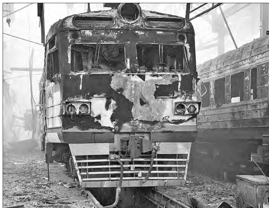
▲ Trenes eléctricos quedaron calcinados en una estación de la ciudad de Fastiv, región de Kiev, tras un ataque aéreo ruso ayer.

Copyright: Project Syndicate, 2025. www.project-syndicate.org