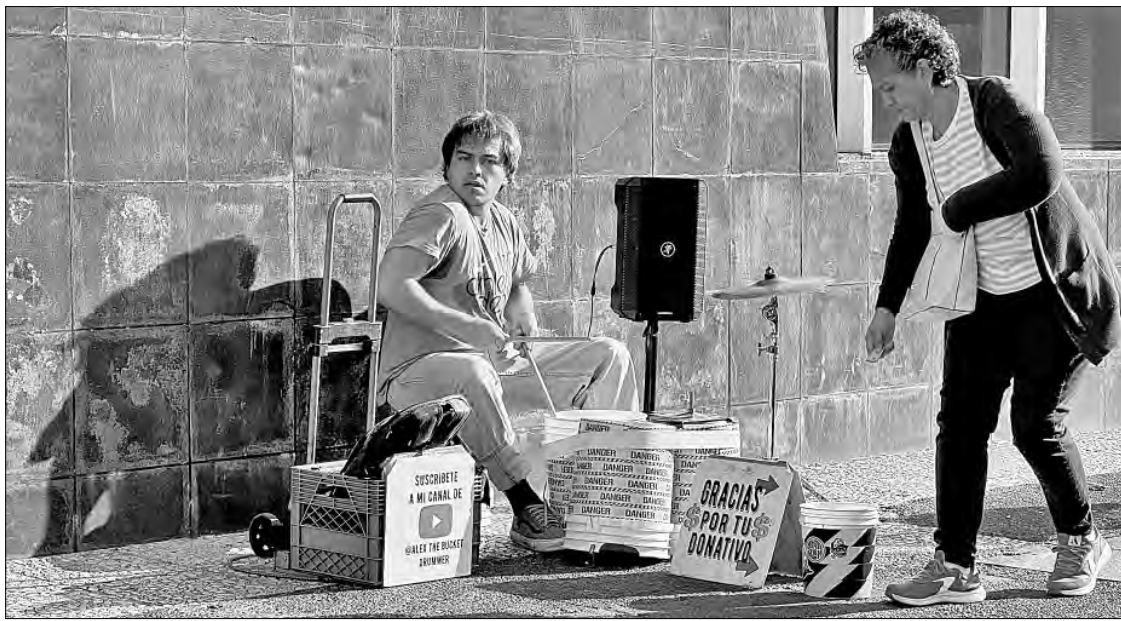
▲ Unas cuantas percusiones para alegrar el alma.