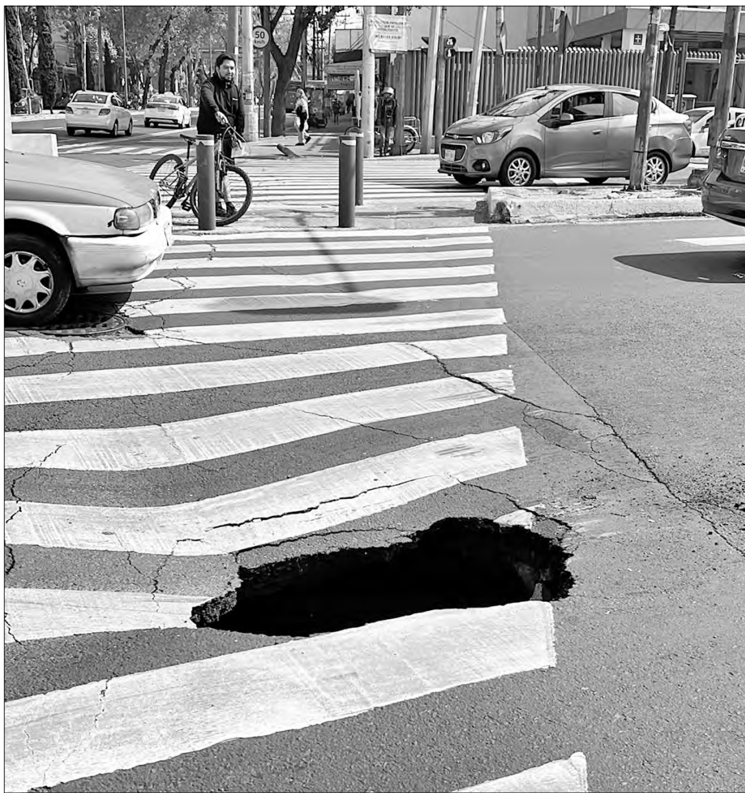
▲ La oquedad se formó en División del Norte y Miguel Ángel de Quevedo.