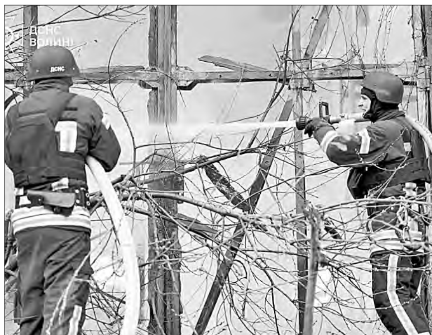
▲ Bomberos extinguen un incendio en el lugar de un ataque aéreo en la región de Volyn, en el contexto de la invasión rusa de Ucrania.