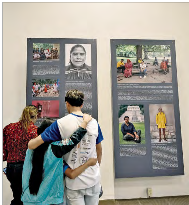
► La exposición fotográfica de Alejandra Barragán y Alexo Castillo propone un viaje por el trabajo, indumentaria y sueños de deportistas de los pueblos mixteco, maya y rarámuri.

El proyecto también involucra la publicación de cuatro libros y un documental.