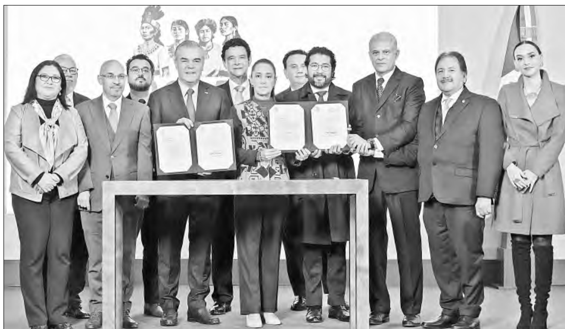
▲ La mandataria y miembros de los sectores obrero y patronal, durante el anuncio del consenso para la enmienda que reducirá la jornada de trabajo.

La presidenta Claudia Sheinbaum destacó que “una vez más, los cambios en el ámbito laboral se dan por consenso, aun cuando en el sector empresarial hubo reticencias