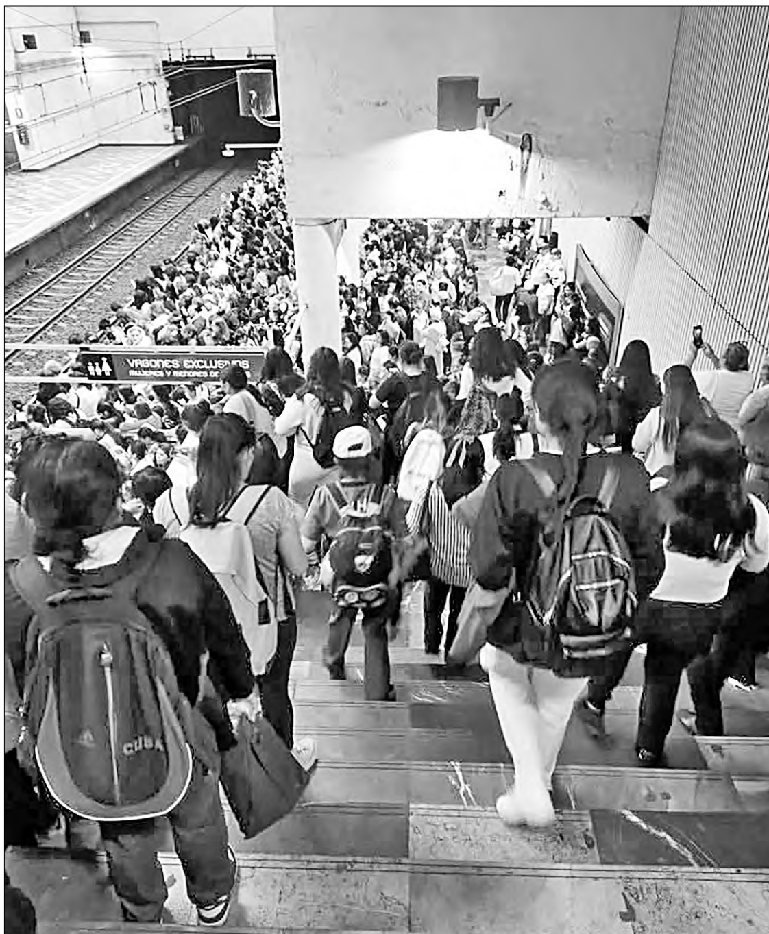
▲ Cientos de usuarios se aglomeraron en la terminal Pantitlán en espera de un convoy, debido a