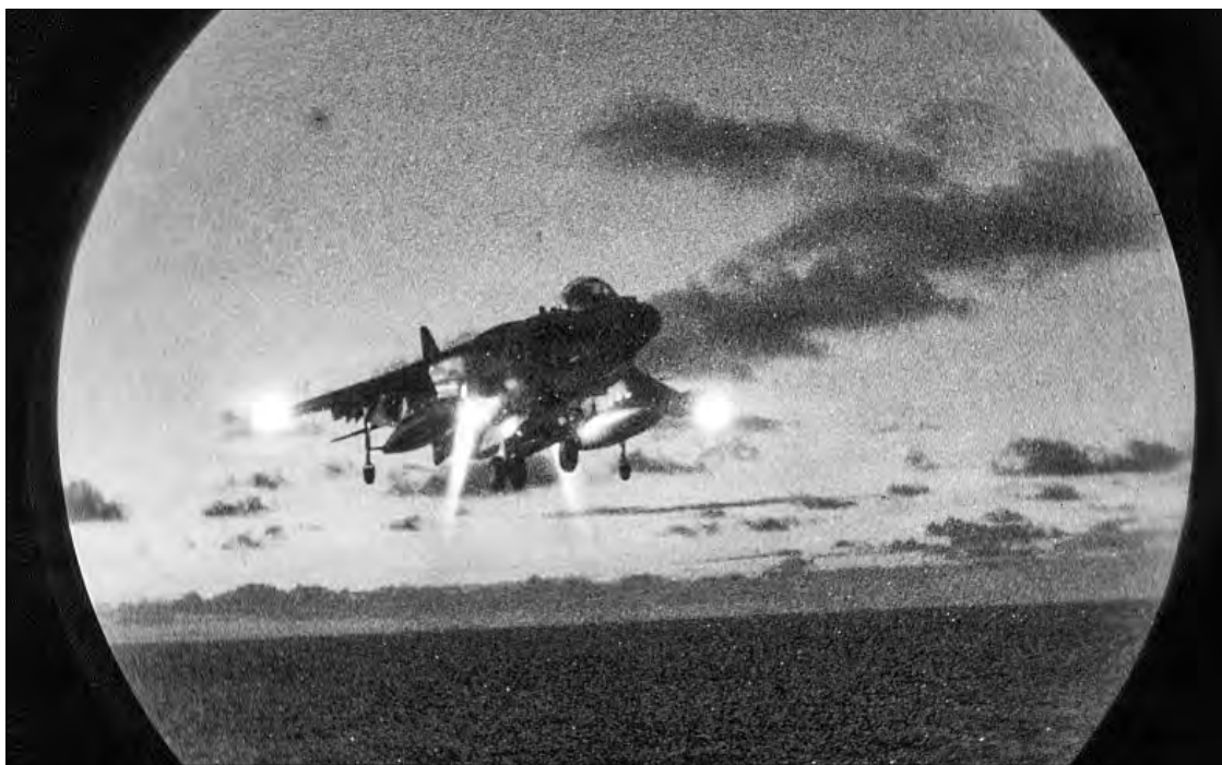
◀ La flota del portaviones estadounidense Iwo Jima realizó vuelos nocturnos sobre el mar Caribe.

El ministro del Interior de Colombia, Armando Benedetti, denunció que su teléfono fue intervenido con el software espía Pegasus fabricado por la firma israelí NSO.