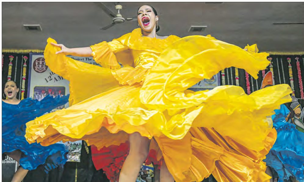
▲ Artistas colombianos realizan una danza durante el Festival Folclórico Cultural