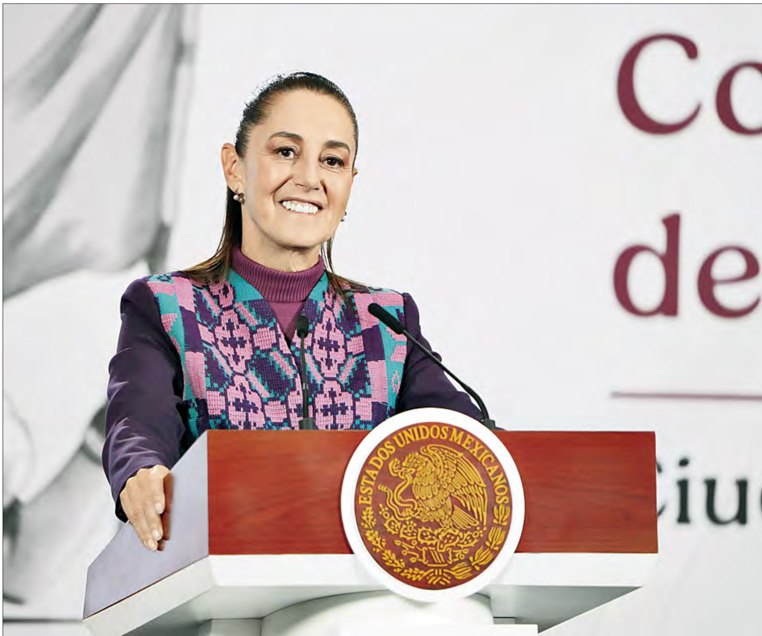
▲ Durante su conferencia mañanera la mandataria confirmó su asistencia y señaló que será un acto muy breve.

Por la noche, el Senado fue notificado sobre la salida de la Presidenta rumbo a Estados Unidos para asistir al sorteo, que se llevará a cabo mañana a las 11 horas tiempo de México en el Centro John F. Kennedy, en Washington.