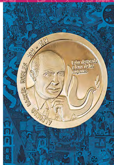
Ceremonia de entrega del reconocimiento Alfonso García Robles

22:00 TIEMPO DE FILMOTECA UNAM: DIANE Y WOODY Un misterioso asesinato en Manhattan (Estados Unidos, 1993) De Woody Allen