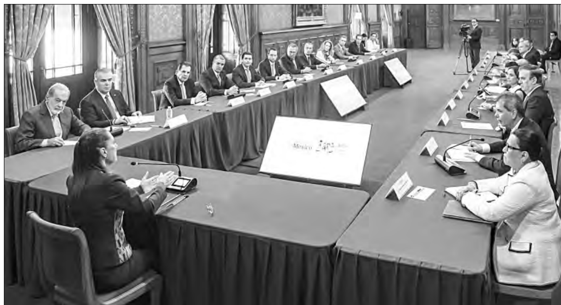
► Reunión en Palacio Nacional con empresarios para crear el consejo para la promoción de inversiones.

Este último, a pregunta expresa, negó que el nuevo consejo sea paralelo al CCE.