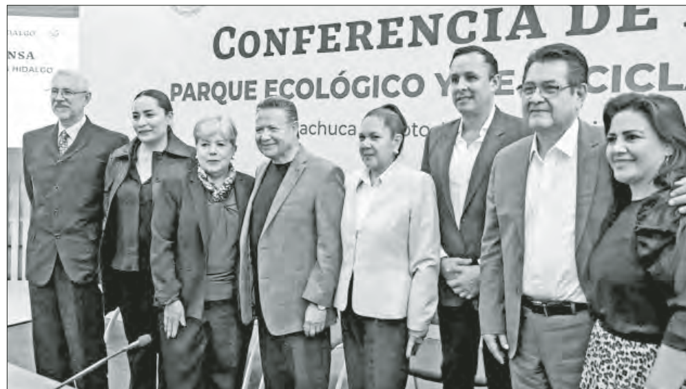
▲ La secretaria de Medio Ambiente, Alicia Bárcena Ibarra, explicó que en el Parque Ecológico y de Reciclaje que se construye en

Y, MIENTRAS TRUMP anuncia su intención de prescindir del tratado norteamericano de comercio y negociar otro tipo de acuerdos con México y Canadá, ¡hasta mañana!