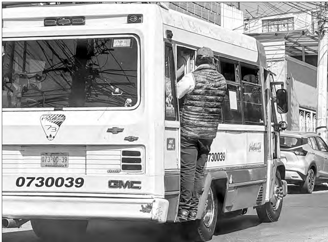
▲ Un microbús de la ruta 73, que circula por calles de la alcaldía Tlalpan, transporta usuarios

en demasía, a pesar de que recientemente fue autorizada el alza al pasaje.