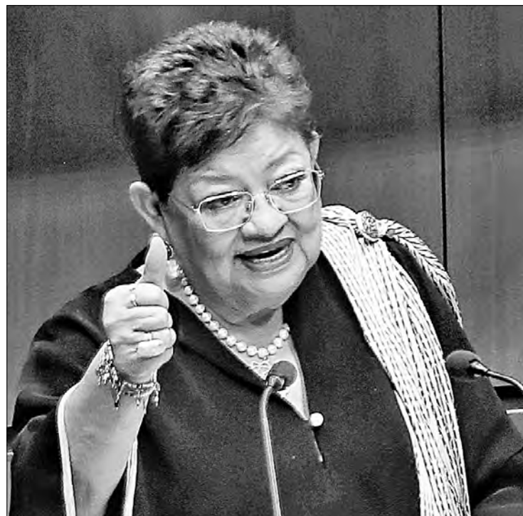
▲ Ernestina Godoy Ramos comparece ante el Senado tras ser nombrada titular de la Fiscalía General de la República.

“Un país que enfrenta a la delincuencia organizada de alto nivel y redes financieras delictivas