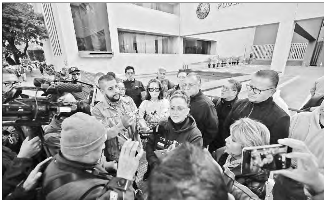
▲Jueces y magistrados cesados en el marco de la reforma judicial pospusieron para el próximo lunes el platón indefinido que iniciarían ayer