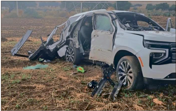
▲ El vehículo en el que viajaba el morenista se impactó con un árbol, luego de que perdieran el control debido a la lluvia.

El percance ocurrió a la altura de la comunidad Los Coyotes, cuando Alfredo González Quiroz regresaba de entregar juguetes