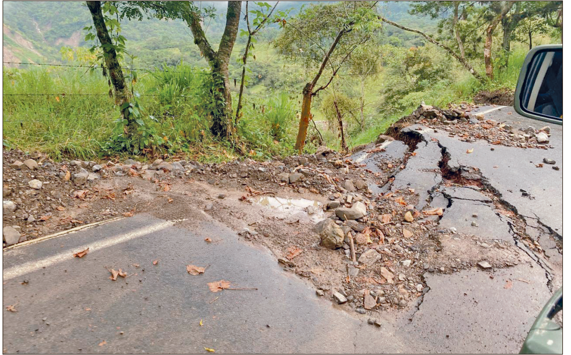
▲ Enfatizaron que el mal estado de las terracerías compromete la seguridad de los conductores.

Esta carretera representa la única vía de acceso para el traslado diario de familias, estudiantes y trabajadores, además de ser