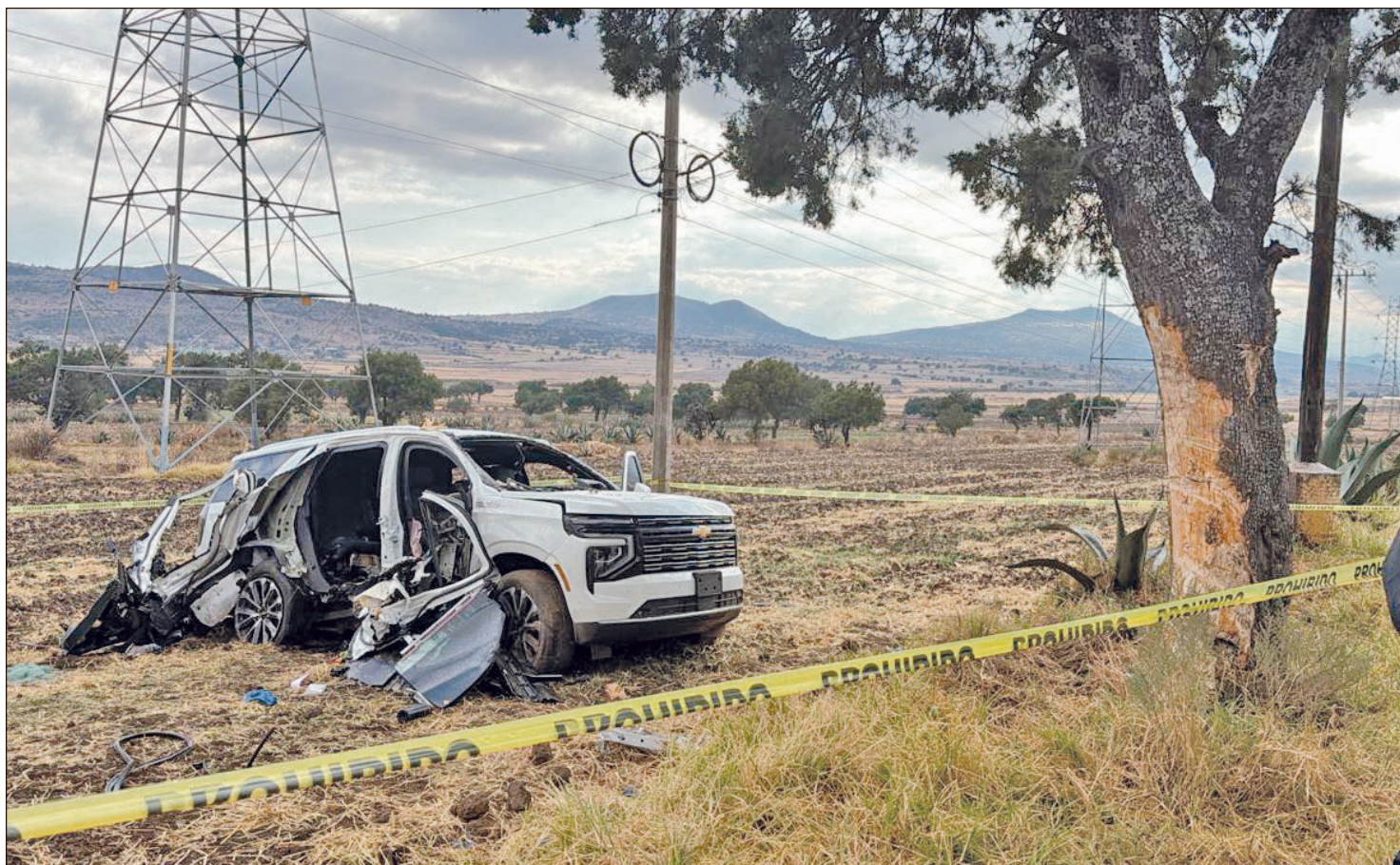
▲ El vehículo en el que viajaba el morenista se impactó con un árbol, luego de que el chofer perdiera el control debido a la lluvia.

Zona centro, foco rojo en consumo de alcohol