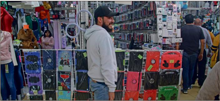
▲ A inicios de 2026 se llevará a cabo la reubicación de los comerciantes ambulantes.

Con la adecuación de este espacio, la administración local pretende ofrecer una alternativa fija a los vendedores y, simultáneamente, brindar una respuesta a la demanda ciudadana de recuperar el libre tránsito en las banquetas y plazas del primer cuadro.