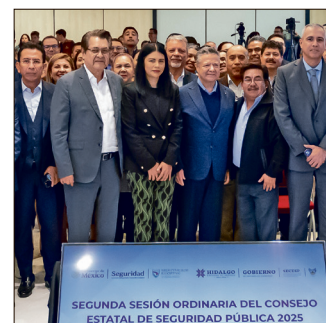
▲ El gobernador reiteró su compromiso de generar políticas públicas para fortalecer a las instituciones de seguridad.