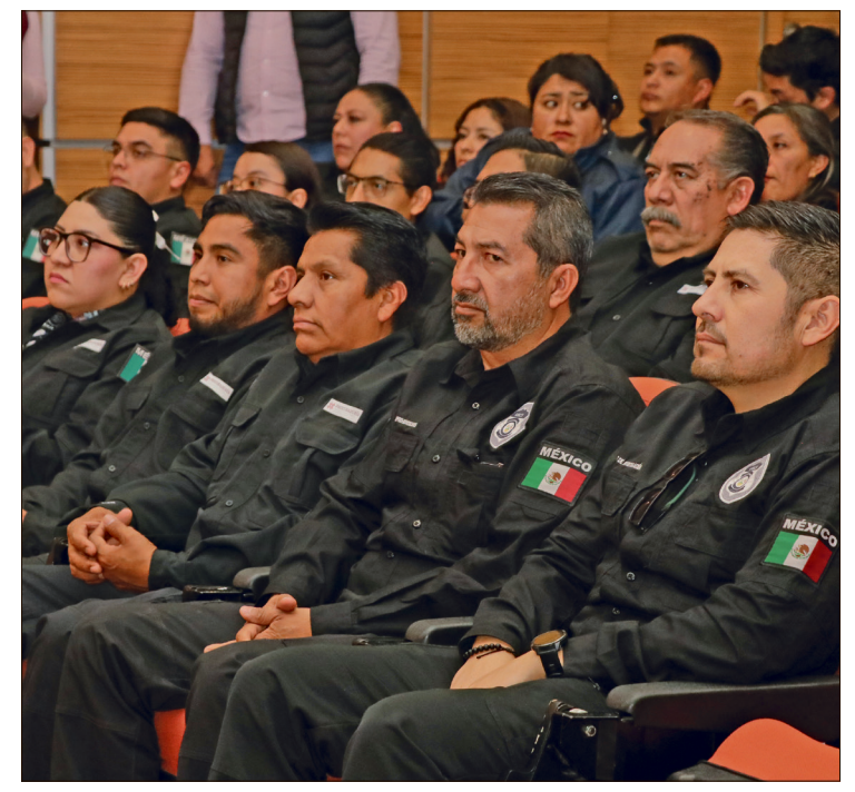
▲ Policias de investigación cumplieron con 100 horas de capacitación en formación inicial, así como 40 horas de evaluación aprobatoria.

Además de las 220 certificaciones que se entregaron a hombres y mujeres que se desempeñan como policías de investigación y que cumplieron con 100 horas de capacitación en formación inicial, así como de 40 horas de evaluación aprobatoria, se encuentran en trámite 111 certificaciones más. “La profesionalización y capacitación permanente de quienes integran la Procuraduría General de Justicia es una meta establecida por el gobernador Julio Menchaca Salazar, con la finalidad de contar con una mejor procuración de justicia, en donde se privilegie la atención integral hacia las víctimas, con un enfoque de derechos humanos”. Estas certificaciones fueron en-