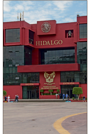
▲ La Secretaría de Gobierno pasará de 897.5 millones de pesos a 960.5 millones.

En cuanto a la Secretaría de Medio Ambiente y Recursos Naturales, con 426.9 millones de pesos para el próximo año, se refleja un incremento, ya que en este 2025 ejerció 410 millones de pesos, y Agricultura y Desarrollo Rural recibirá un monto por 835.2 millones de pesos, cifra que también refleja un aumento comparado con el ejercicio de 2025, que fue de 605.4 millones de pesos, es decir, 229.8 millones de pesos más para el campo.