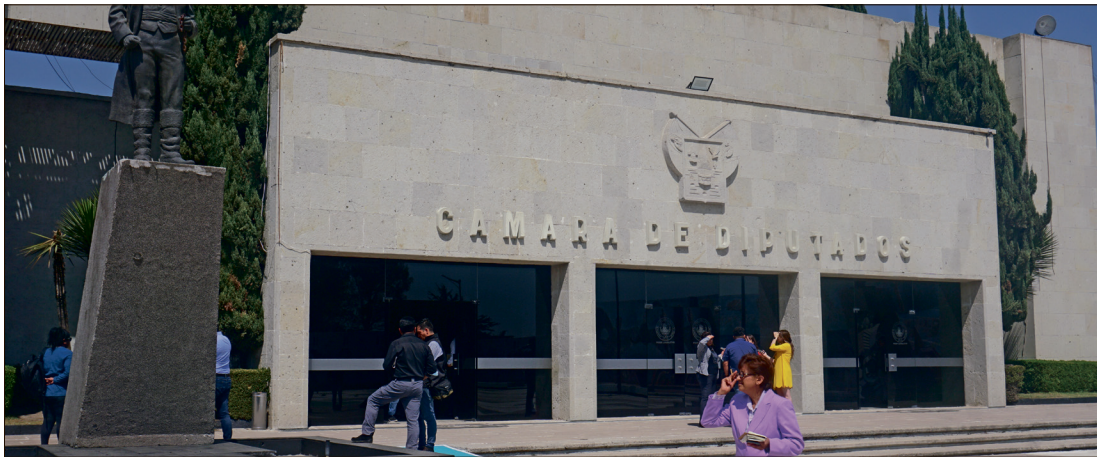
▲ Se autorizó la asignación presupuestal que le corresponderá al Poder Legislativo para el siguiente año.