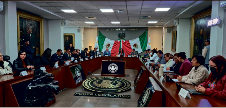
▲ Los documentos se avalaron por mayoría de votos por los legisladores.