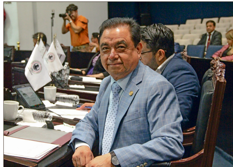
▲ El diputado morenista descartó que el Legislativo hubiera recibido una instrucción federal para pausar la iniciativa.

A pesar de ello, Velázquez Vázquez indicó que podrían retomar el tema nuevamente en enero con la realización de estos foros para recabar propuestas y evitar caer en una acción de inconstitucionalidad.