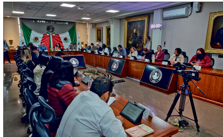
▲ La ley se aprobó por el Congreso local con dos votos en contra emitidos por los legisladores del PRI.

Esto con el objetivo de obligar a pagar a quienes sean contaminantes y poder financiar proyectos de energías limpias y se generen fondos locales.