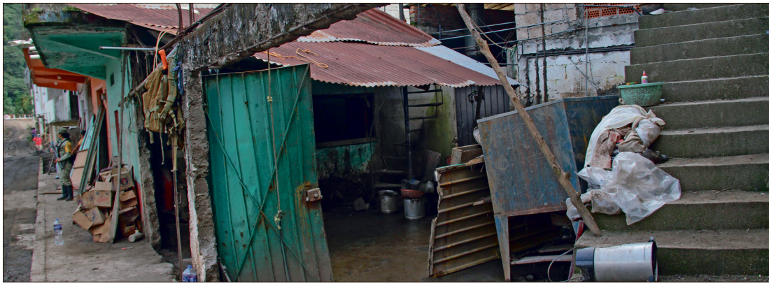
▲ Aprueban recurso para atender la emergencia por las lluvias del pasado mes de octubre.