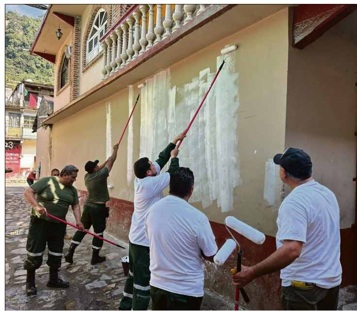
▲Esta iniciativa de mejora estética ha contado con el respaldo fundamental de la iniciativa privada.

Finalmente, las autoridades informaron que, mientras se