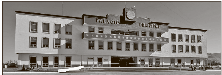
▲ Esta práctica ya tiene un precedente en el municipio.

Ambas adquisiciones se realizaron bajo la misma partida presupuestal específica (382001 Gastos de Orden Social y Cultural), consolidando esta acción como un evento recurrente en los festejos de fin de año.