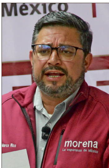
▲ El dirigente del partido en el estado explicó que el parque entraba dentro del paquete de rescate de la región.

Por su parte, el gobernador Julio Menchaca Salazar dijo que la negativa de instalar el parque “retrasa el compromiso de poder estar traba-