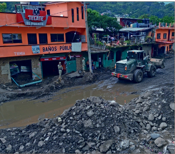
▲La reconstrucción en el municipio se concentra en restaurar la normalidad. La prioridad es la reconstrucción de viviendas.

pec celebrará su posada navideña en la presidencia municipal, buscando llevar un momento de convivencia a sus habitantes en estas fechas.