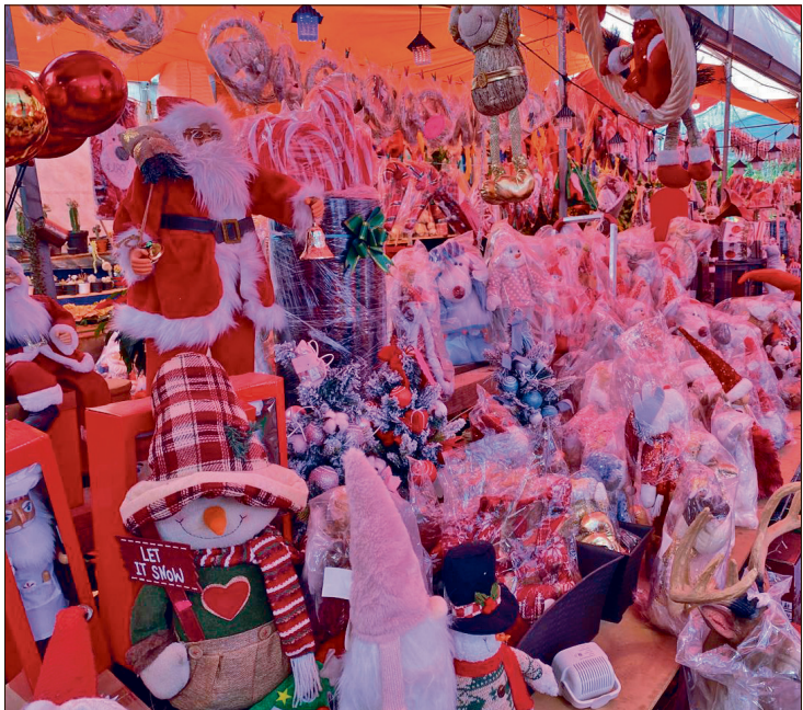
▲ Desde la edición del Buen Fin la demanda de productos y servicios se ha incrementado.

buscar buenos productos y servicios para nuestros consumidores finales, que al final del día son los que marcan las compraventas”, indicó. Recordó que desde la edición del Buen Fin la demanda de productos y servicios se ha incrementado, particularmente en servicios como alimentos y escuelas particulares. Aunque algunos comerciantes del centro de la capital expresaron que la falta de adornos navideños en plaza Juárez como tradicionalmente se hace, ha afectado la afluencia de consumidores en el primer cuadro de la ciudad, Gamiño Ríos descartó esto asegurando que las ventas se mantienen. “Sin duda es un atractivo... no considero que se vean repercutidas las ventas por la carencia de este, al final de cuentas el hogar tradicional ya tiene sus compras programadas cada año y esto es indistinto de que haya un árbol en Plaza Juárez o no”, refirió.