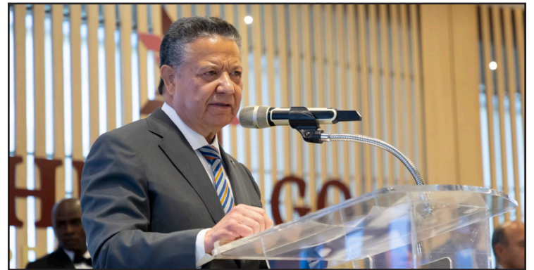
►El gobernador detalló que el proyecto representa una inversión de 416 millones de pesos y se desarrolla sobre una superficie total de 127 mil 965 metros cuadrados.

En cuanto a la atención a los asistentes, el Centro Deportivo Hidalguense contará con tres cafeterías nuevas, módulos de baños con regaderas, gradas con capacidad