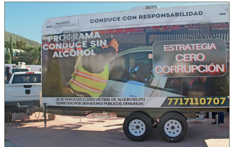
▲ El reforzamiento responde al incremento de accidentes viales relacionados con consumo de alcohol.

Ante cuestionamientos sobre el contrato que contempla hasta 30 desayunos y 30 cenas, Reyes explicó que el número es un tope