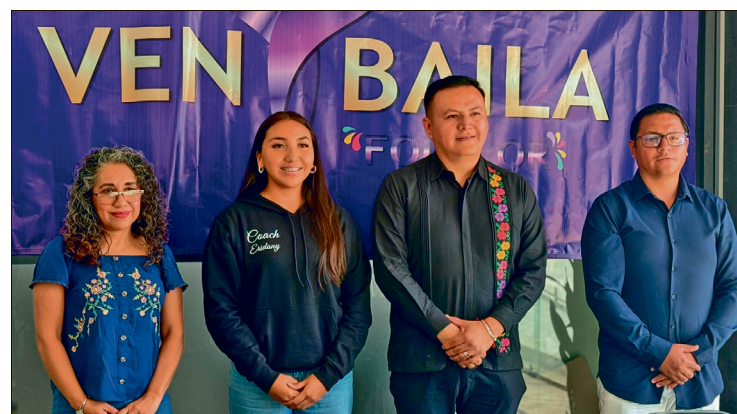
▲ Informaron que la convocatoria de este año reunió inicialmente a 30 parejas, pero solo siete fueron seleccionadas.

solo está enfocado en competir, sino en que cada pareja avance técnica y artísticamente.