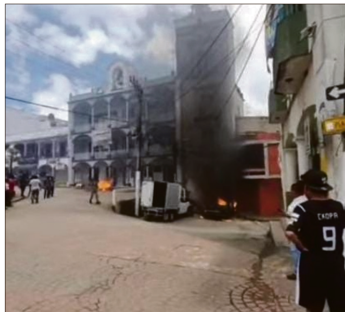
▲ Los ocho imputados ofrecieron una disculpa pública a las instituciones y al particular afectado por hechos ocurridos en 2023.

La manifestación escaló cuando los pobladores se dirigieron a la casa del alcalde, quien logró escapar por la azotea. No obstante, los manifestantes ingresaron a su domicilio, prendieron fuego a su auto y robaron pertenencias.