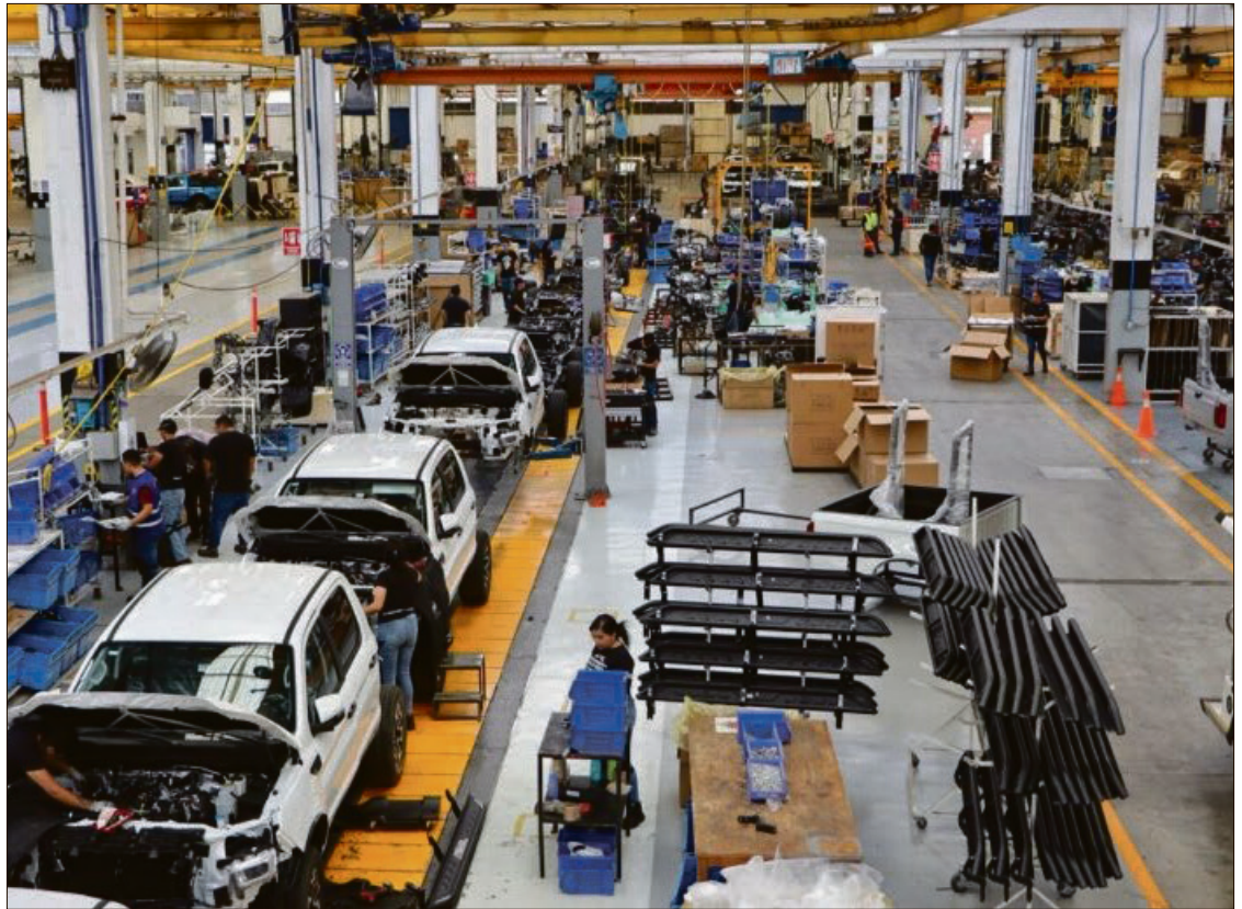
▲Hidalgo se integró a la lista de los estados que lideraron el crecimiento económico del país.

En el décimo puesto se ubicó Hidalgo, cuyo PIB se incrementó en 2.8%, superando a Chiapas, que cerró la tabla de los punteros con 2.7%.