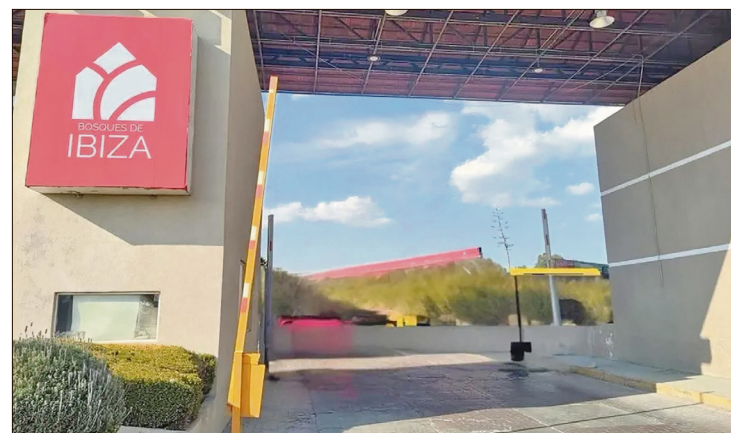
▲ El sujeto fue identificado con las iniciales J.A.C.F., quien recibió disparos en el brazo y la pierna; lo despojaron de unos 300 mil pesos.

Hasta el momento no se reportan personas detenidas. Autoridades mantienen abiertas las investigaciones correspondientes con el objetivo de localizar y detener a los responsables.