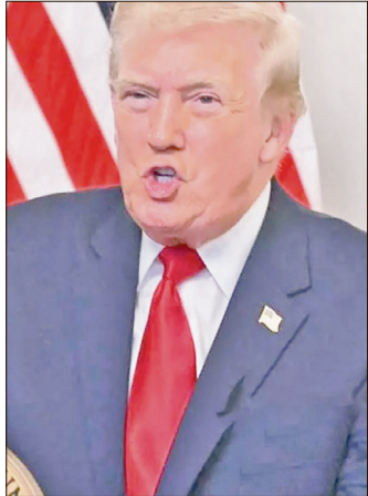
▲ Representaría el primer ataque terrestre desde que comenzó su campaña de hostigamiento en aguas del Caribe.

Washington ha intensificado en los últimos meses la presión contra Maduro, a quien señala como líder del llamado Cartel de los Soles y por cuya captura ofrece una recompensa de 50 millones de dólares, acu-