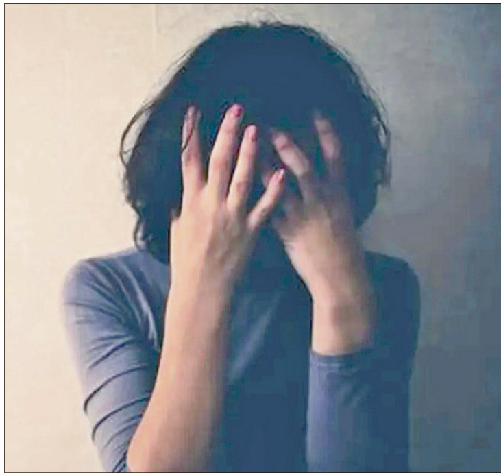
▲ Las mujeres representan aproximadamente 80.17% de las atenciones médicas por depresión en Hidalgo.

A nivel nacional, la suma total de atenciones en lo que va del año asciende a 140 mil 025 casos, con