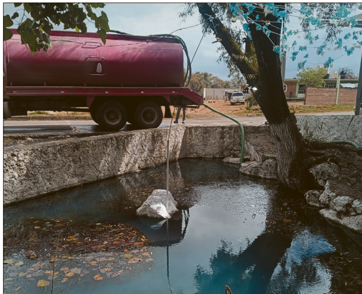
▲ Videos que habitantes han hecho llegar a La Jornada Hidalgo muestran unidades de la CAPASCHH llenando sus pipas directamente del manantial Almoloya.

El suministro de esta agua del manantial Almoloya se debe a que el fraccionamiento ha sido dejado nuevamente sin el servicio de agua corriente en sus domicilios.