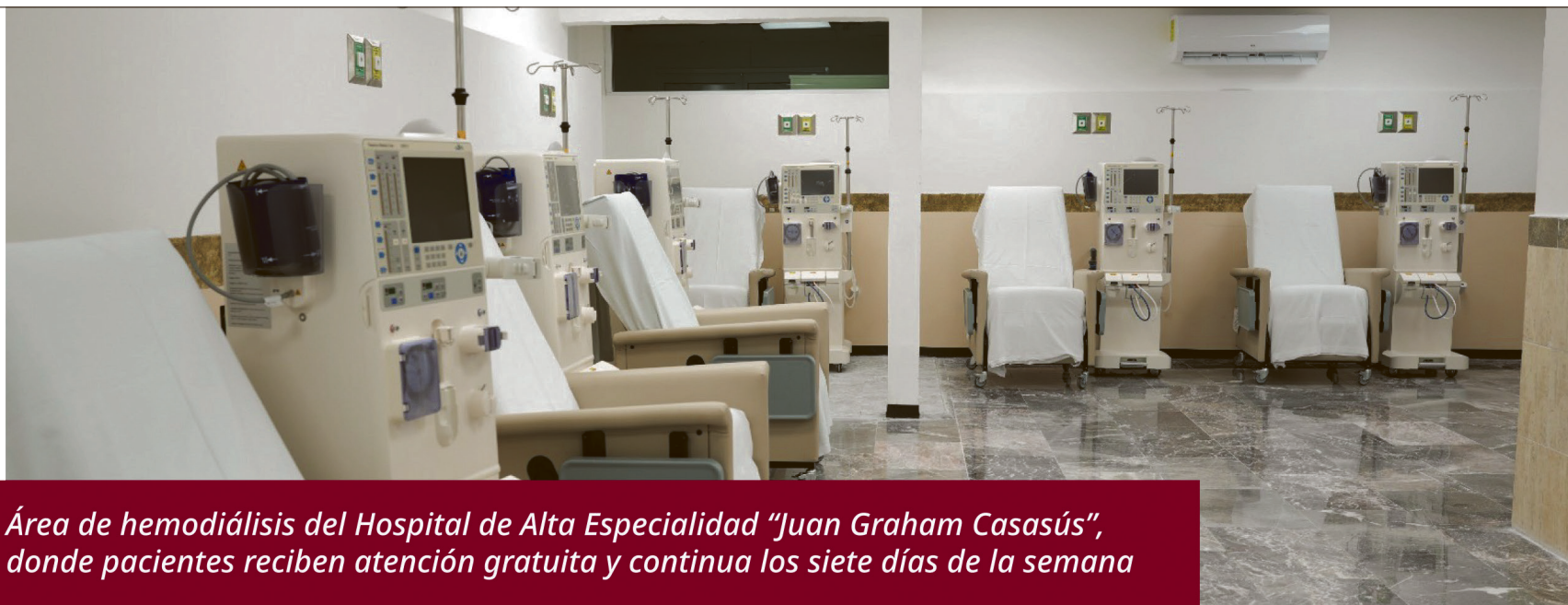
Área de hemodiálisis del Hospital de Alta Especialidad “Juan Graham Casasús”, donde pacientes reciben atención gratuita y continua los siete días de la semana