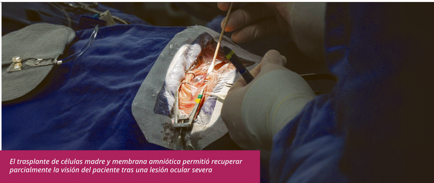
El trasplante de células madre y membrana amniótica permitió recuperar parcialmente la visión del paciente tras una lesión ocular severa