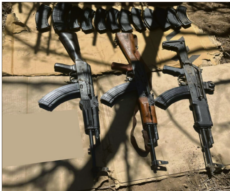
▲La PGJEH ha analizado 400 armas incautadas; se ha identificado su procedencia de Estados Unidos, Alemania, Bélgica e Italia.

Aunque no descartó solicitar más recursos para el próximo año, no quiso dar una cifra al respecto, bajo el argumento de que continúan haciendo un análisis sobre lo que se necesita de manera urgente para mejorar el servicio.