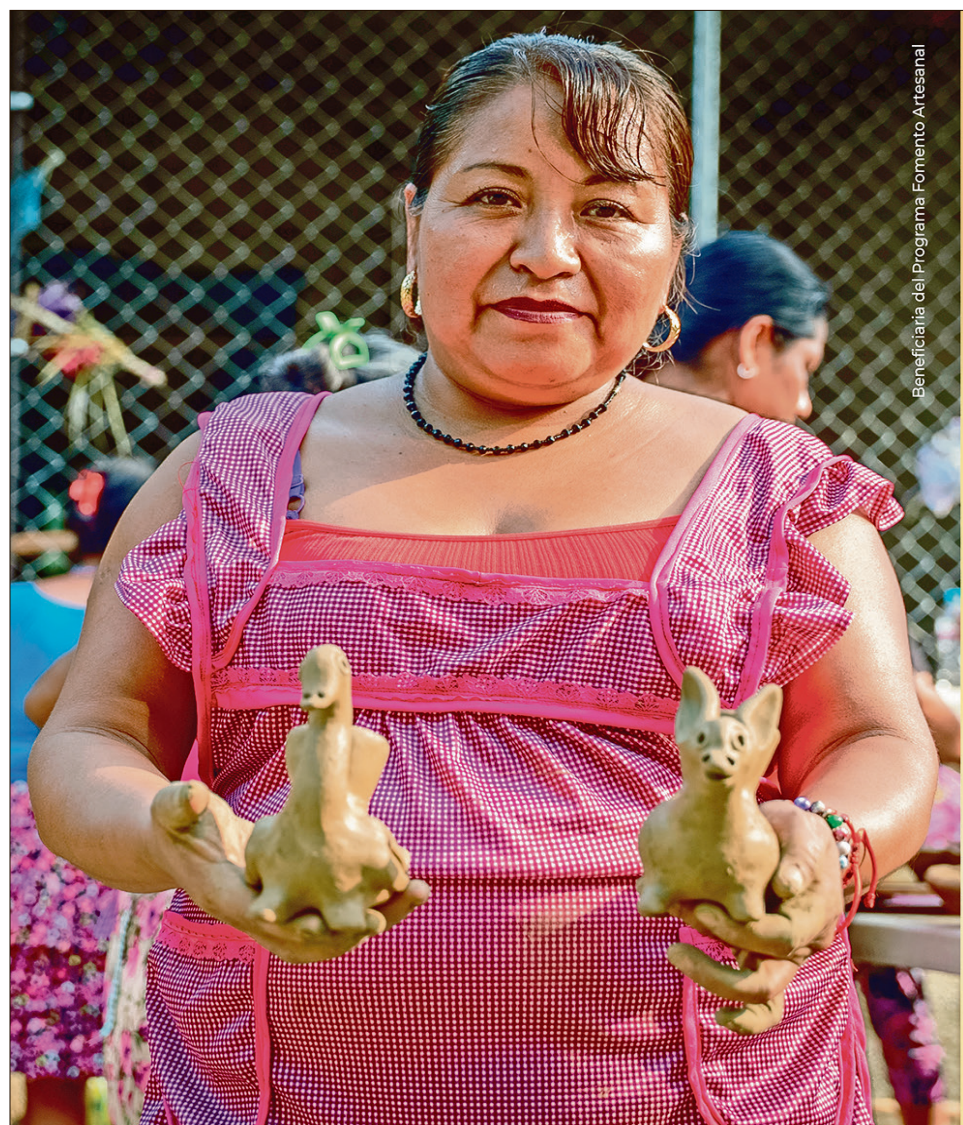
Beneficiaria del Programa Fomento Artesanal

Con estas acciones, la directora Oviedo Gámez y la Secretaría de Turismo buscan impulsar la recuperación y promoción de los cinco museos del Archivo Histórico y Museo de Minería, fortaleciendo su presencia en el circuito turístico de Pachuca-Real del Monte y garantizando que la cultura minera siga siendo un atractivo para locales y visitantes.