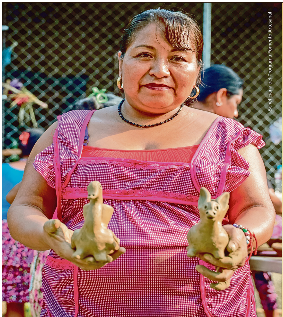
Beneficiaria del Programa Fomento Artesanal

La seguridad, explicó, será coordinada entre Policía Estatal y Municipal.