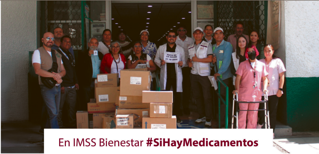
En IMSS Bienestar #SiHayMedicamentos