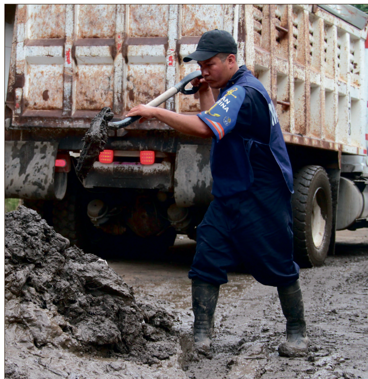
▲ Huehuetla se convirtió en una de las demarcaciones que más daño registró con las lluvias de octubre, no solo en la cabecera municipal sino en las comunidades que lo integran.

La funcionaria dijo que avanza la instalación de una biblioteca del FCE en el Teatro Hidalgo. El acervo equivalente a una inversión de 3 millones de pesos ya está comprometido; únicamente falta adquirir mobiliario.