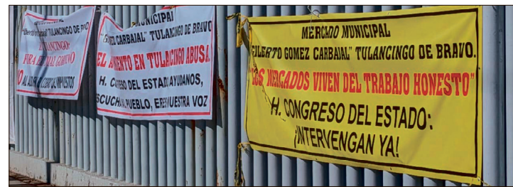
▲ Los inconformes solicitaron la intervención de los legisladores.