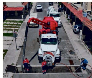
▲ La Dirección de Drenaje Sanitario llevó a cabo 200 servicios de desazolve.

El fortalecimiento de la infraestructura hídrica y sanitaria se evidenció también en los trabajos de campo realizados por las distintas áreas operativas. En materia sanitaria, la Dirección de Drenaje Sanitario llevó a cabo 200 servicios de desazolve, limpiando 11 mil 392 metros lineales de tubería y 530 pozos de visita y rejillas.