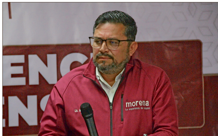
▲ Rico está en contra de los $652 millones 109 mil 601.64 que plantea el IEEH para actividades ordinarias, prerrogativas a partidos y preparación del proceso electoral.

Dicha cifra, consideró el morenista, debe analizarse para saber si es excesiva o no, pues no es año electoral y la revocación de mandato no se llevará a cabo, toda vez que, si bien hasta enero debe definir el IEEH si se juntaron las rúbricas necesarias