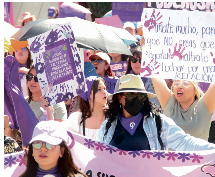
▲ Buscan fortalecer la visibilidad del arte feminista como un medio de resistencia, sanación y transformación social.

Las organizadoras destacaron que este primer encuentro busca abrir espacios seguros y creativos para mujeres artistas en Hidalgo, fortaleciendo la visibilidad del arte feminista como un medio de resistencia, sanación y transformación social.