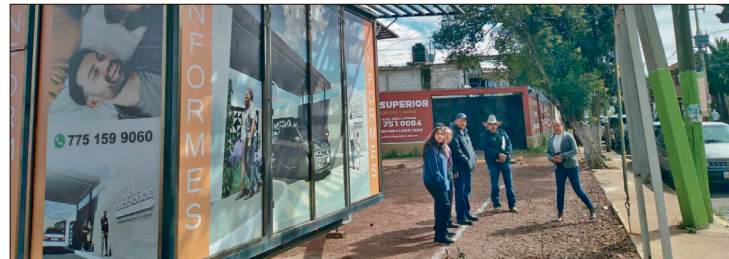
▲ Sospechan de irregularidades en el otorgamiento de la licencia municipal.

Finalmente, aseguraron que han solicitado formalmente el permiso de construcción y sus