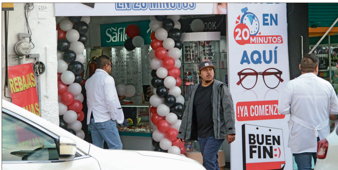
▲ Comerciantes de la región de Tulancingo señalaron que no tienen información alguna sobre el evento, así como tampoco conocen sus beneficios.

Lo último que se supo de la dirección fue en 2023, cuando se opusieron públicamente a la instalación de tiendas chinas en el municipio. En aquel momento, comerciantes, con respaldo de la Canaco-Servytur, instalaron un plantón frente al Edificio México, en la calle de Cuauhtémoc, en el primer cuadro de la ciudad, buscando impedir la apertura de un nuevo establecimiento de productos importados.