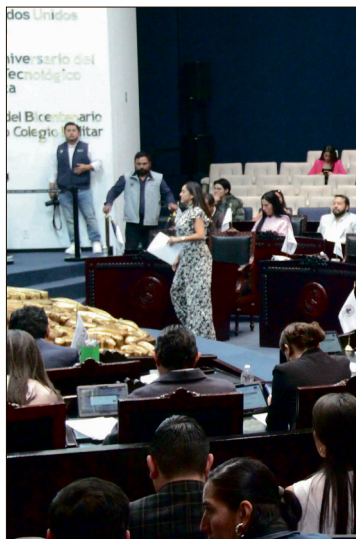
▲ Iniciarán el próximo 19 de noviembre y concluirán el viernes 28 del mismo mes.