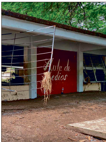
▲ Los daños estructurales están siendo atendidos por parte de una aseguradora, mediante terceras empresas.

totepec colapsó un muro de contención, una barda perimetral y su taller de electricidad, pero las reparaciones ya tienen 60% de avance.