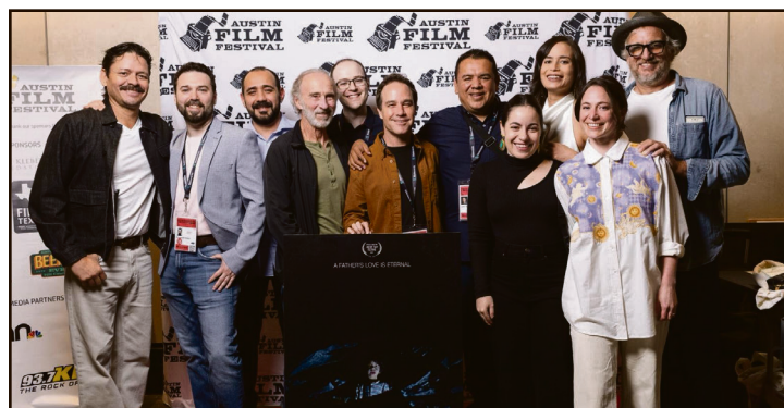
▲ El filme fue escrito por Mauricio Chernovetzky y Alexander Iosjpe ".

Tras las proyecciones, el público tuvo la oportunidad de conversar con el talento de Sacrificios sobre la complejidad temática de la película, su carga simbólica y el desafío intelectual y vi-