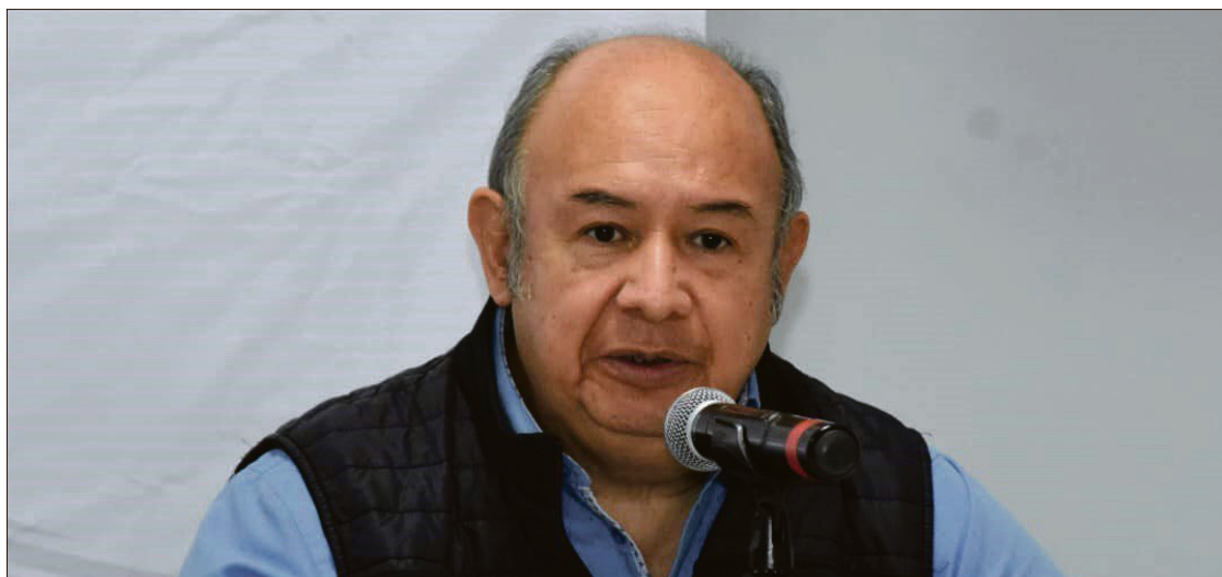
▲ Para poder acceder a un apoyo estatal deberán comprobar que se encuentran dentro de la formalidad, informó el subsecretario de Desarrollo Económico, Horacio Ríos Cano.

Adelantó la posibilidad de generar un primer apoyo en materia de soporte financiero para poder reactivar sus comercios, “estamos trabajando para ofrecer una alternativa que les ayu-