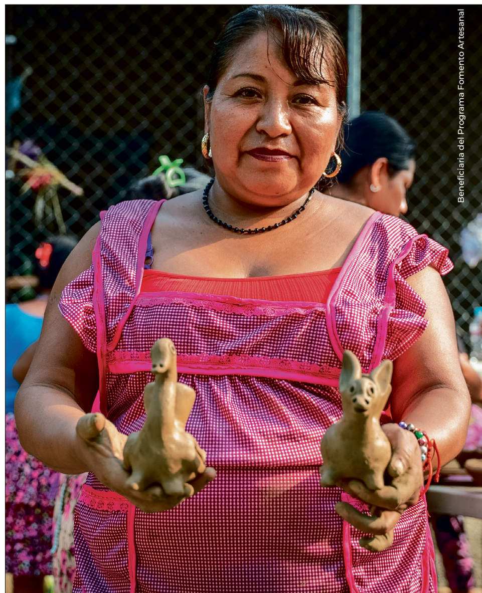
Beneficiaria del Programa Fomento Artesanal

El procurador estatal Francisco Fernández Hasbun señaló que se mantienen abiertas líneas de investigación sobre la operación de células criminales con el objetivo de evitar su asentamiento en Hidalgo.