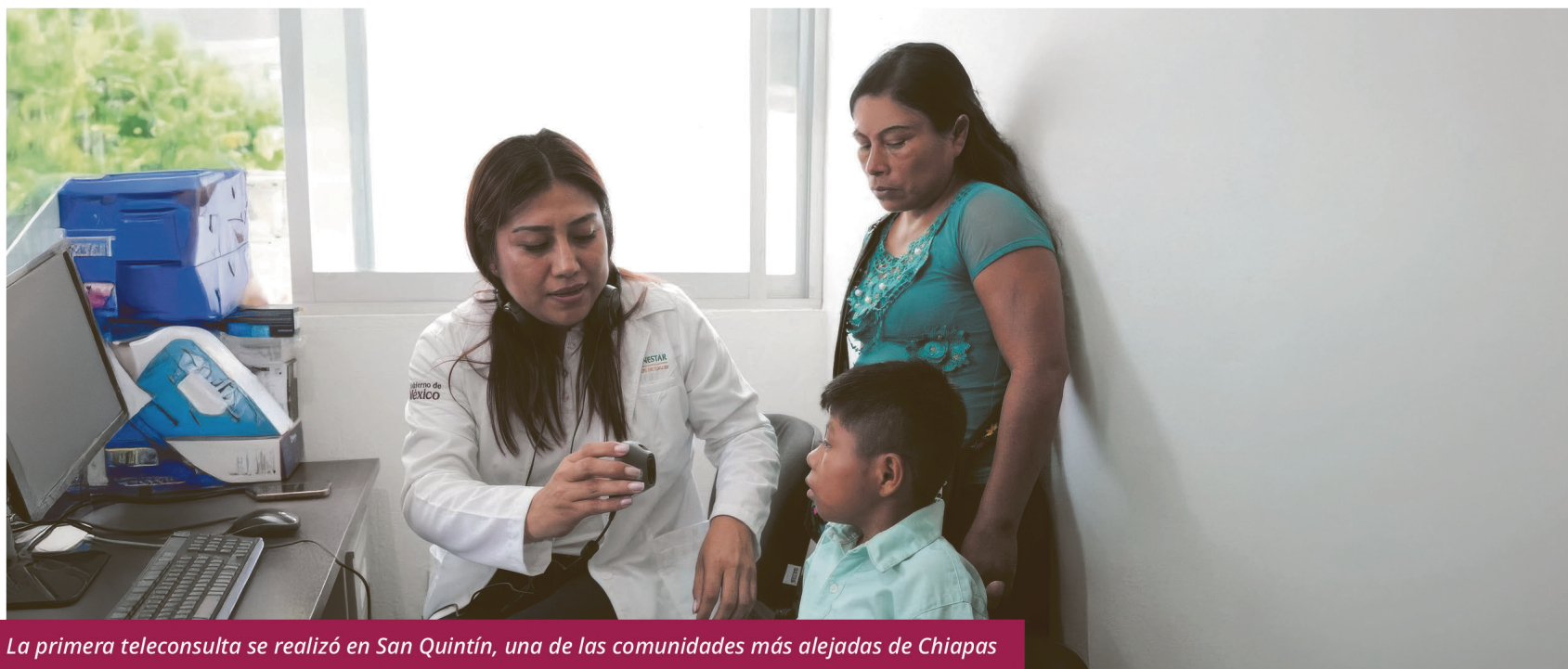
La primera teleconsulta se realizó en San Quintín, una de las comunidades más alejadas de Chiapas