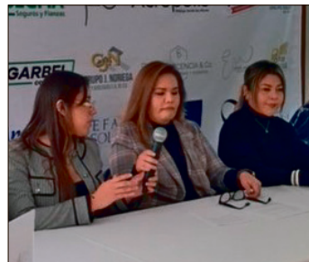
▲ La asociación abarca rubros como el campo, la ciencia, industrial, construcción, inmobiliaria y más.

“Es un multisector en donde las mujeres encuentran un espacio de apoyo. No somos competencia de nadie, sino que buscamos sumar a lo que ya existe. Además, dentro de nuestros