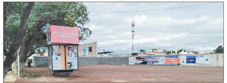
▲ Presuntamente, el propietario obtuvo permisos municipales para construir sobre el conducto.

Usuarios del canal de riego del manantial Los Cangrejos y Río San Lorenzo denunciaron esta semana que sus derechos al uso del agua han sido coartados