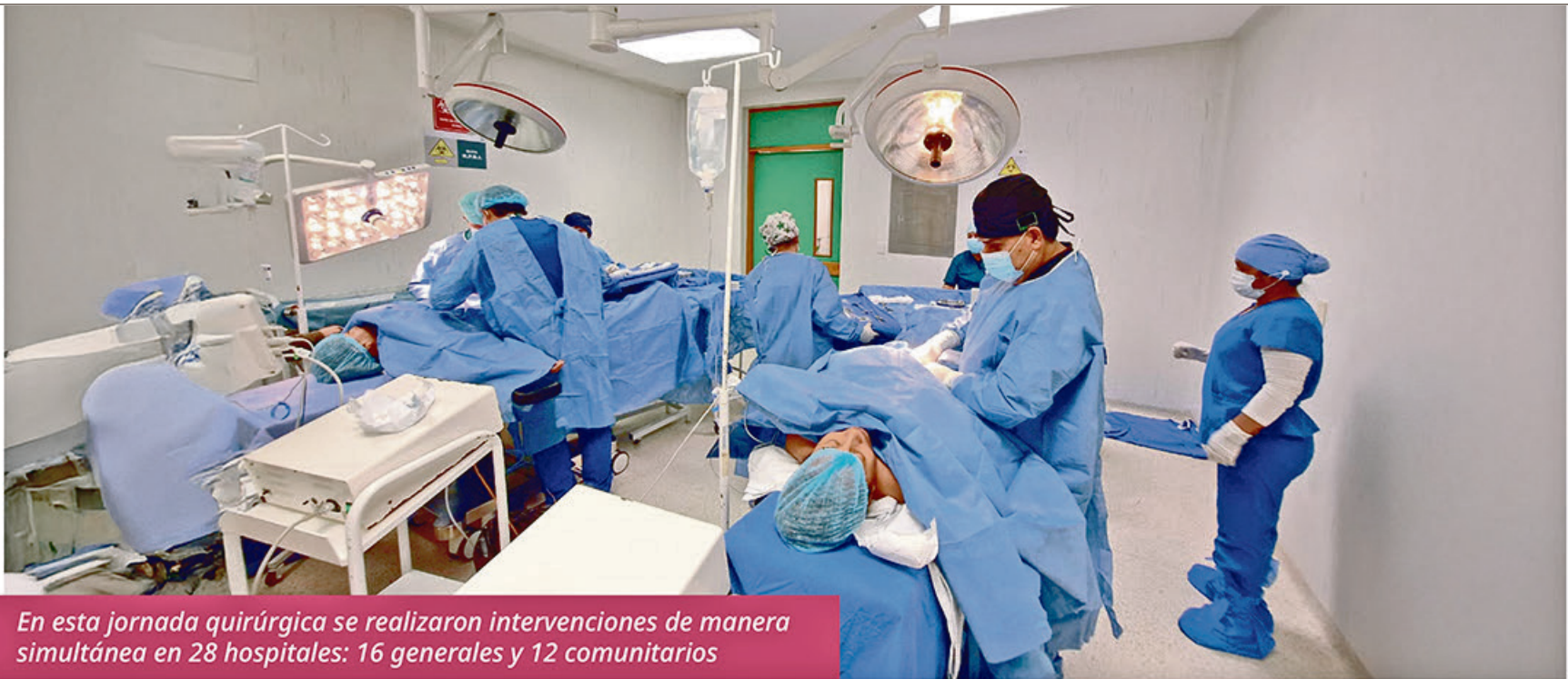
En esta jornada quirúrgica se realizaron intervenciones de manera simultánea en 28 hospitales: 16 generales y 12 comunitarios