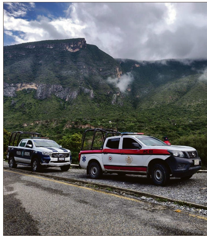
▲ Autoridades estatales establecieron comunicación con los municipios de la región.

Las autoridades locales no reportaron víctimas ni afectaciones en infraestructura pública o privada.